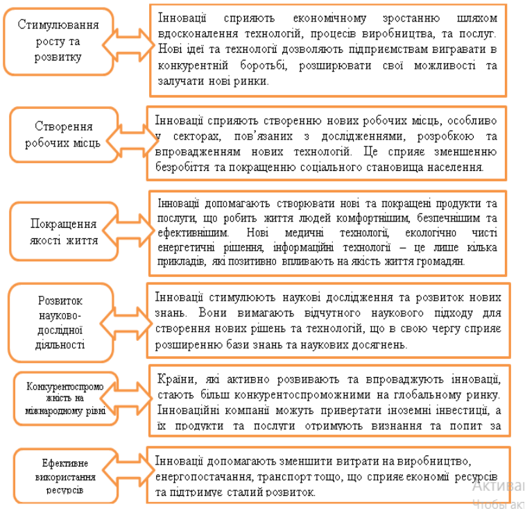
Рис. 1. Характерні риси інновацій

У сучасному світі інновації є ключовим фактором, який визначає успіх і стійкість економічного розвитку країни. Вони стимулюють зміни, сприяють вирішенню складних проблем, розширюють можливості та відкривають нові горизонти для подальшого просування підприємств та суспільства вперед.