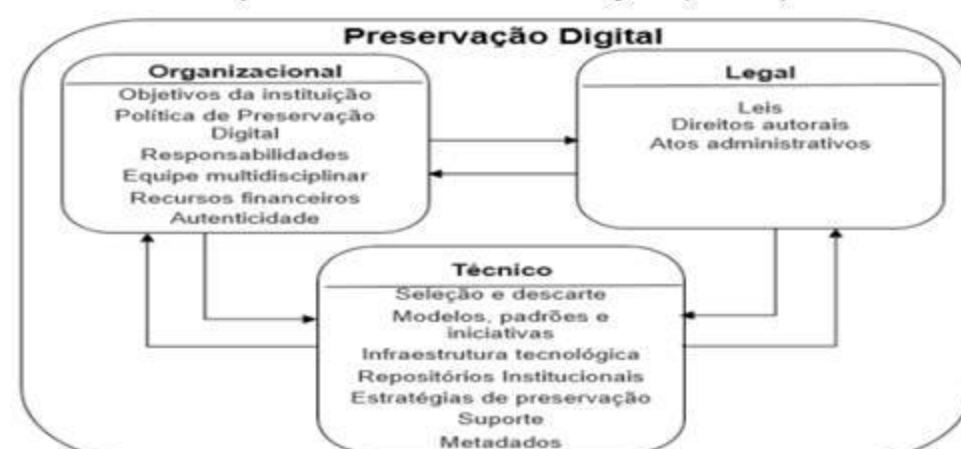
Figura 2 – Elementos para preservação digital