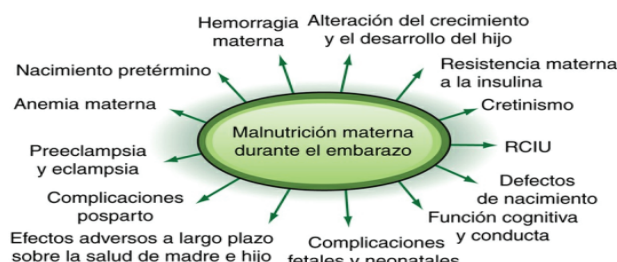
FIGURA 15-1 Principales efectos negativos de la malnutrición materna (tanto subnutrición como hipernutrición) sobre la madre y el lactante.