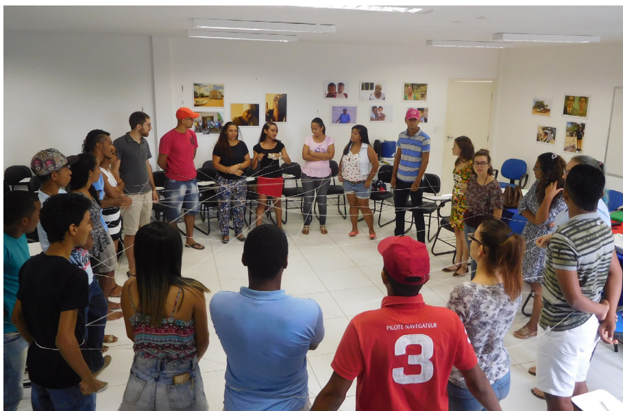
Figura 3: Dinâmica sobre relações interpessoais, DCH III, UNEB.

No ano de 2019 (semestre 2019.2), a disciplina apresentou uma especificidade única no que diz a respeito à participação das(os) discentes. A turma se constituiu por estudantes dos cursos de graduação em pedagogia e jornalismo, do DCH III, intercambistas italianas(os) da UNIPD e pessoas da comunidade, entre as quais as profissionais que compunham a equipe psicossocial da ONG que oferecia acolhimento e serviços à adolescentes em conflito com a lei na cidade de Juazeiro-BA. ONG na qual, por mais uma temporada, uma das intercambistas italianas e uma estudante do curso de pedagogia do DCH III, UNEB, desenvolveram a parte prática da disciplina.