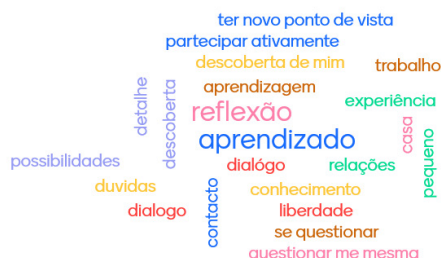
Figura 4: nuvem de palavras do questionário final – Mentimeter .