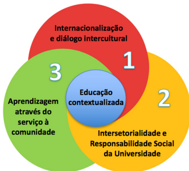
Figura 1: as dimensões do programa Intereurisland . Andrian (2020, p. 84)

Dentro deste amplo quadro se inserem diversas atividades desenvolvidas ciclicamente a cada ano letivo, entre elas, as que estão sendo apresentadas no detalhe como a seguir.