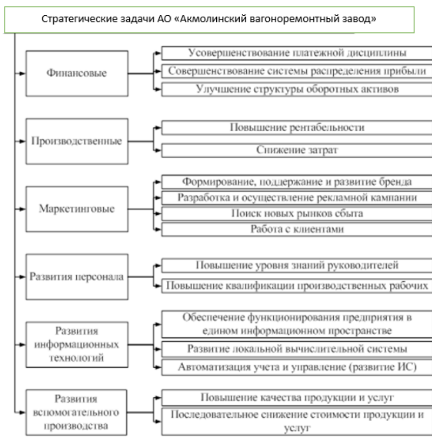
Рис. 2 Структура стратегических задач АО «Акмолинский вагоноремонтный завод»

Таким образом, решение объявленных стратегических задач позволит реализовать указанные подстратегии развития предприятия, что приведет к достижению выявленных стратегических целей и выполнению миссии всей организации. Также при реализации разработанной стратегии значительно увеличится финансовая устойчивость предприятия, оно будет меньше страдать от резких изменений уровня экономики Алтайского края и всей страны в целом.