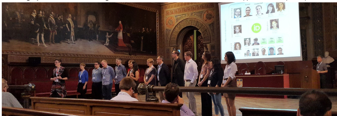
Nhóm ORCID trong cuộc họp giữa ORCID-CASRAI tại Đại học Barcelona, tháng 5/2015