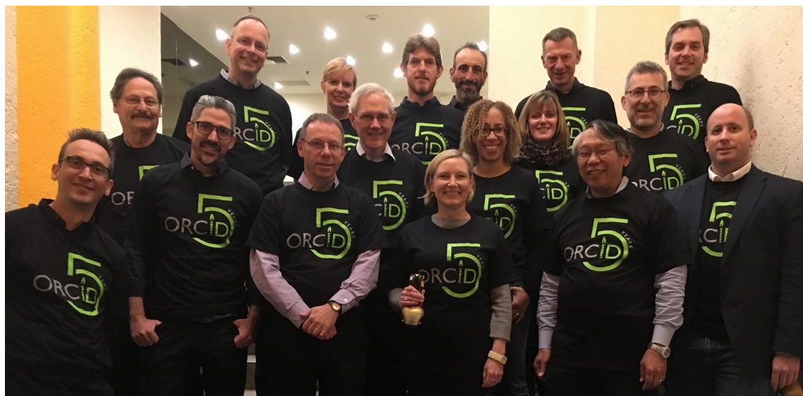
Nhóm ORCID, 2015

Để thúc đẩy cam kết của ORCID về điều hành do cộng đồng dẫn dắt, và trong bối cảnh cơ sở hỗ trợ được mở rộng của ORCID giữa các thành viên cơ sở của nó, một sửa đổi đối với các quy định đã được thông qua để chuyển Hội đồng quản trị từ mô hình tự tồn tại (bỏ phiếu cho các thành viên mới hoặc tiếp tục của chính mình) sang bầu cử từ và bởi các tổ chức thành viên của ORCID, bắt đầu từ năm 2016.