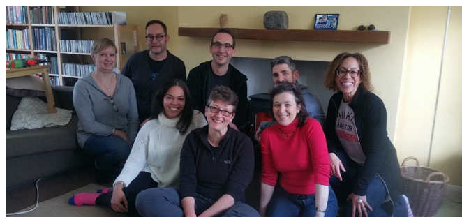
Mở rộng Nhóm ORCID, 2016