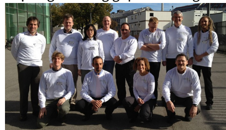
ORCID ra đời, tháng 10/2012