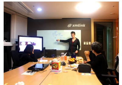
Chương trình Áp dụng & Tích hợp ORCID