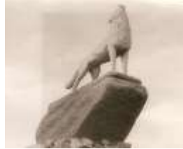
Şəkil: 7, "Bozqurd" abidəsi, Şəmkir, 1992 Heykəltaraşlar Azad Əliyev və Sahib Quliyev, Azərbaycan