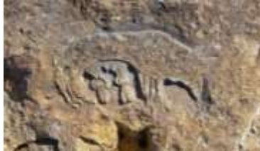
Şəkil 3, Türkiyənin Balıkesir ərazisinin Ayvalık ilçəsindəki Lale adasında relyef