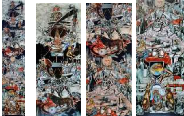
Şəkil: 9, " Türk dünyası ", rəssam Fəxrəddin Seyfəddinoğlu, Azərbaycan