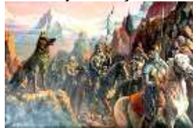
Şəkil: 8, " Ərgənəqondan (Ergenekon) çıxış - 1 ", rəssam - Ratip Tahir (Burak) 1933, Türkiyə