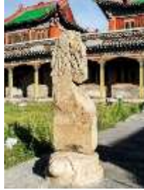
Şəkil: 5, Buqut kitabəsi bu gün Çeçərleq Muzeyinin başçasında sərgilənir. Monqolustan