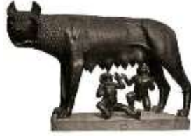
Şəkil: 4, Dişi canavar, Rem və Romul. tunc heykəl, Palazzo dei Conservatori