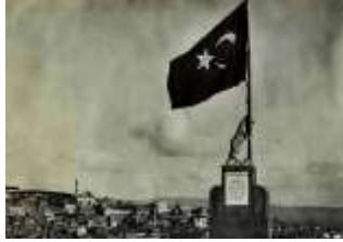
Şəkil: 6, Qəhrəmanmaraş qalasında "Bayraq tutan Boz Qurd" heykəli, Türkiyə