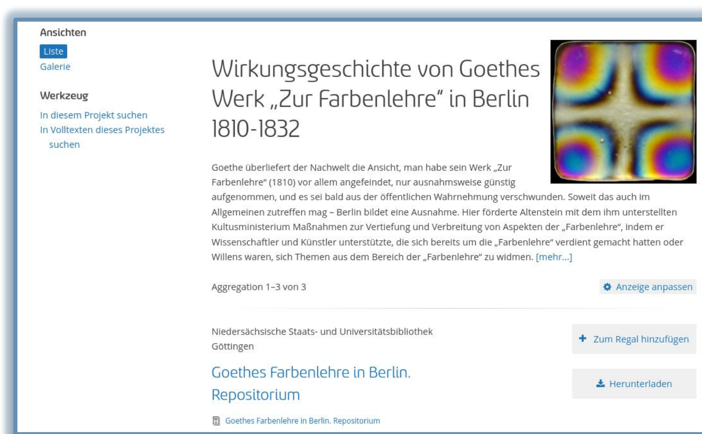
Beispiel einer „Landing Page“, mit der ein Projekt Einführungstexte und Logo präsentieren kann. https://s.gwdg.de/EyRiXs