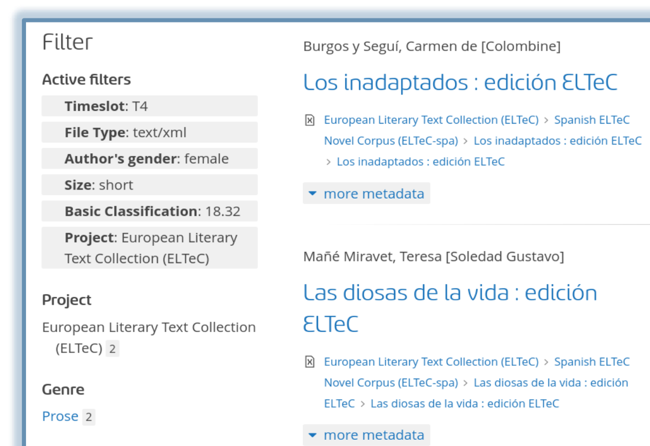
Beispiel projektspezifischer Suchfilter: Projekte können anhand eingegebener Metadaten die Suchfunktion im Repository anpassen. https://s.gwdg.de/r4im3C