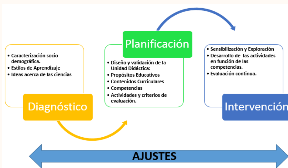
Figura 1. Modelo de Intervención docente.

El siguiente modelo representa el proceso que se llevó a cabo para la intervención didáctica.