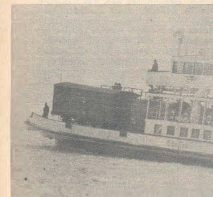
Letzte Schiffsverbindung über den See: Die Fähre Romanshorn-Friedrichshafen. Krachend bahnt sich die massive 'Schussen' einen Weg durch das dicke Eis.

An den wenigen Stellen, wo man noch offenes Wasser findet, drängt sich die Vogelwelt in hellen Scharen. Trotzdem sind die munteren Schwimmer und geschickten Flieger, die uns im Sommer mit ihren Künsten erfreuen, in seltenen großen Not geraten und benötigen daher unbedingt menschliche Hilfe, sollen sie die Härten dieses gar langen Winters überstehen.