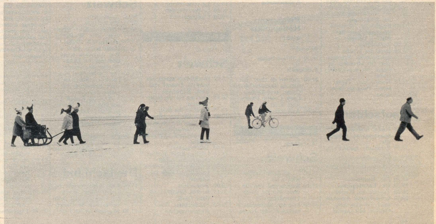
Ein freundschaftlicher Besuch führte die Mitglieder der Narrenzunft der 'Hennenschlitter' aus-Immenstaad quer über den See nach Münsterlingen.