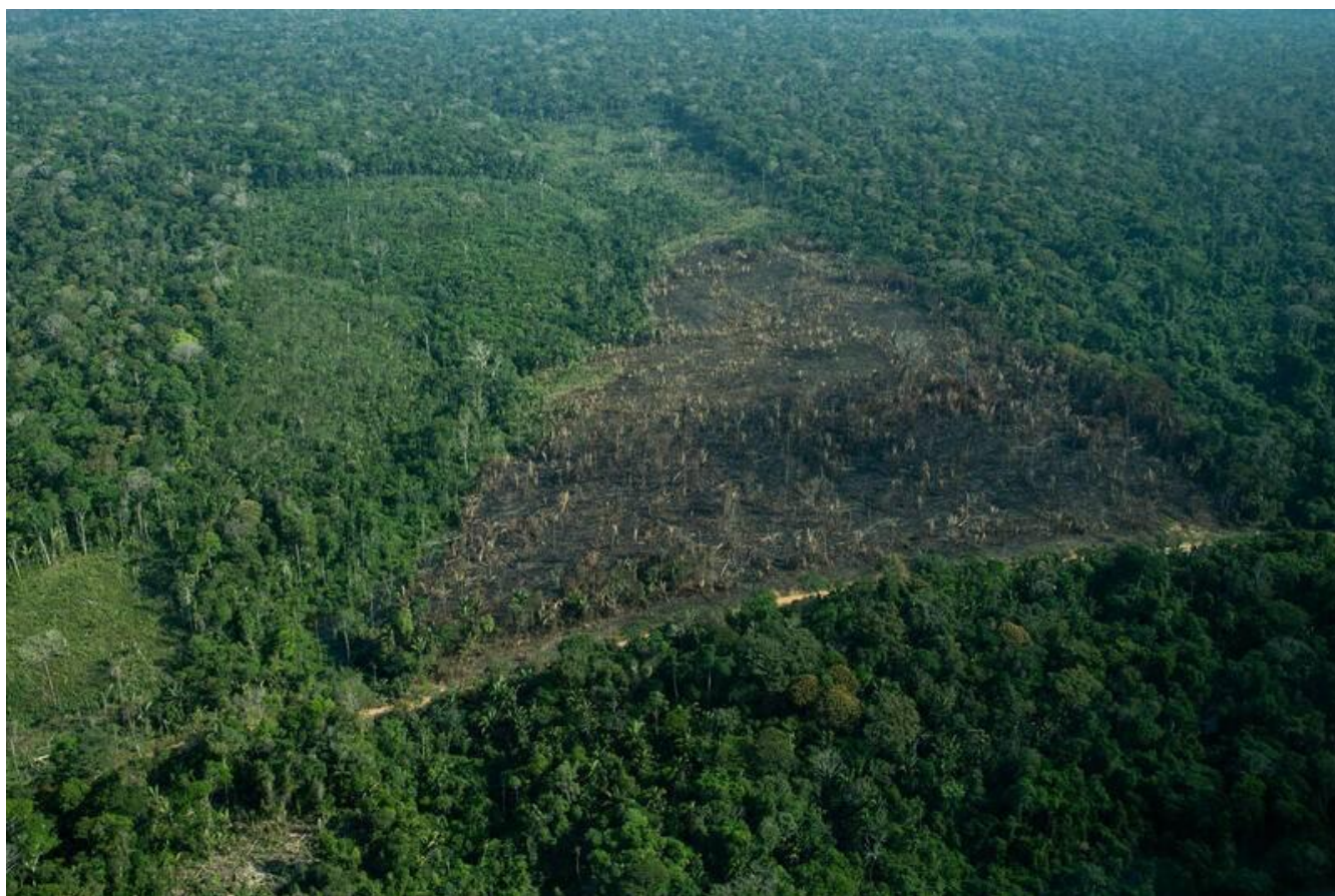
Figura 5- Monitorar desmatamento

O sobrevoo oferece uma visão ampla de lugares distantes e de difícil acesso. Logo, com essas pequenas máquinas é possível ir a lugares onde estejam ocorrendo desmatamentos e, com a localização precisa, combatê-los (ALDO, 2020).