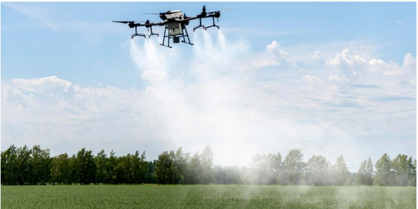
Figura 4- Pulverização

Essa função consegue embarcar até 18 litros de químicos. Essa aplicação feita pelo drone pode ser mais eficiente pela proximidade das plantas e mais segura