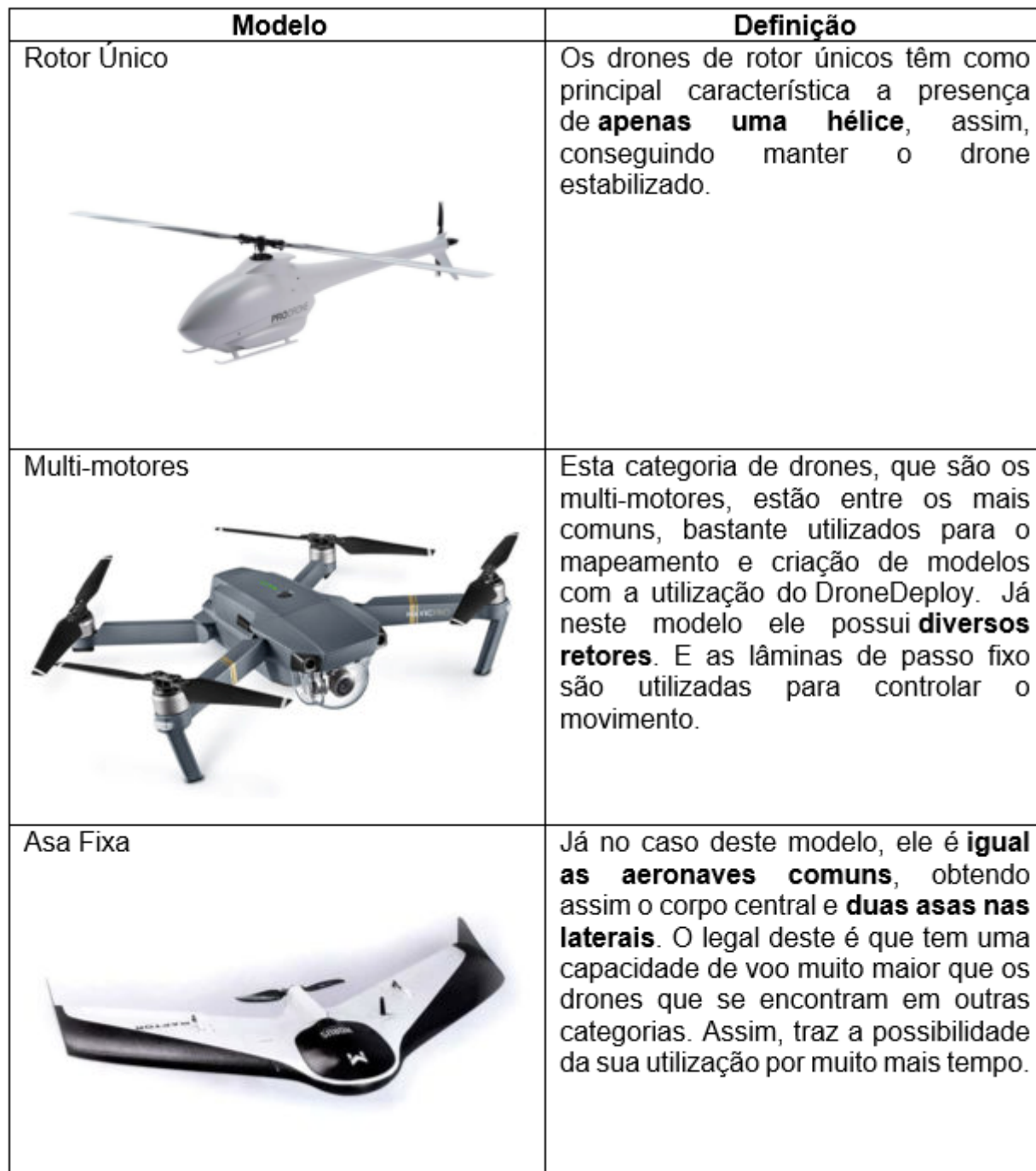
Quadro 1 – Modelos de drones e suas funções

É muito importante saber a distinção entre os diversos tipos de drone disponíveis no mercado. São três as categorias que podemos destacar, os drones multi-motores , rotor únicos e com asa fixa .