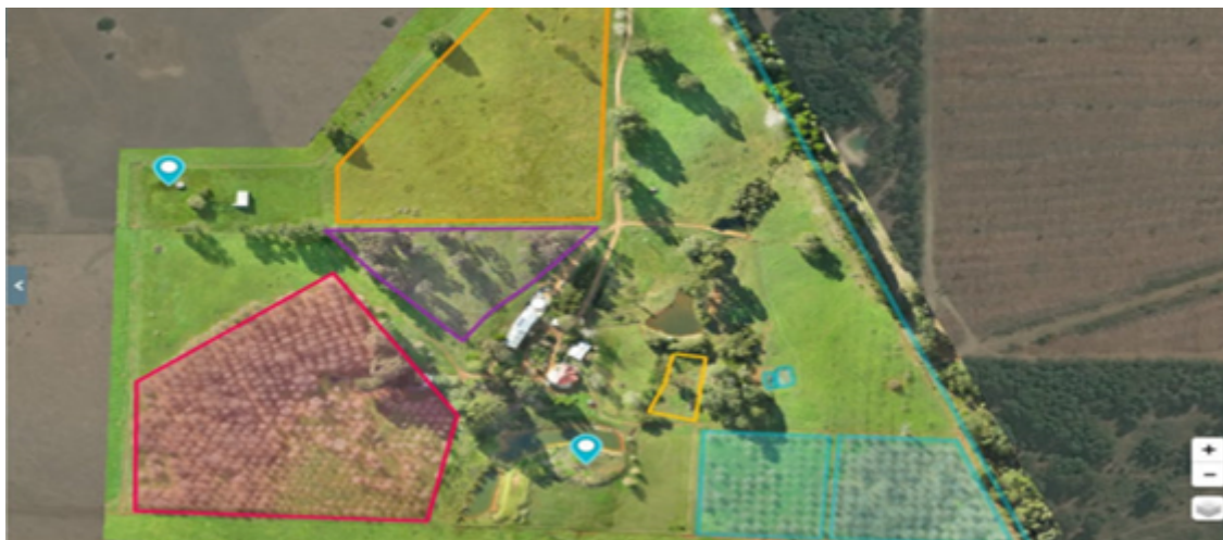
Figura 2- Demarcação de plantio

Para saber em que área plantar, o drone é ideal já que proporciona uma visão do alto de forma fácil e ágil, podem analisar, de acordo com as imagens captadas, quais são as áreas de sua fazenda que estão mais propícias para a semeadura (ALDO, 2020).