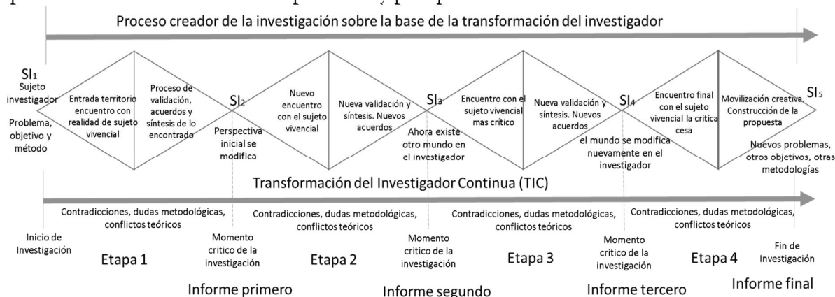
Figura 1. Mecanismo y proceso de investigación: abrir y cerrar

Salto epistémico segundo, Conciencia práctica: El sujeto investigado crea conocimiento. La figura a continuación presenta la trayectoria del proceso: investigador (conocimiento académico) y el investigado (conocimiento vivencial) se encuentran y se modifican, afectándose mutuamente, en la medida que avanza la investigativa. Por tanto, la idea es conocer como esta sociedad chimboracense reflexiona sobre su base material y, además, lograr entender que se encuentra en proceso de construcción en esta provincia y por qué.