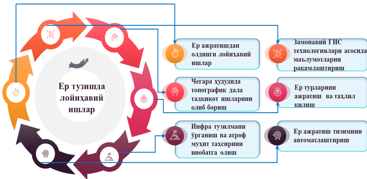
2-расм. Ер тузишда лойиҳавий ишларни илмий томонлама амалга ошириш механизми

Бугунги кунда ер тузишда лойиҳавий ишларни илмий таъминланганлик даражаси мақтанарли эмас. Айниқса қишлоқ хўжалиги ва ноқишлоқ хўжалигида илмий изланишлар олиб борилмаган. Бунда айтарли жиддий ютуқларга эришиш учун ер тузиш ва уларнинг лойиҳа ишларининг умумуслубий жиҳатларини илмийлигини ошириш ва уларга аниқлик қиритиш учун назарий билимларнинг зарурий йўналишларини асосийларини кўриб чиқиш мақсадга мувофиқ (2-расм).