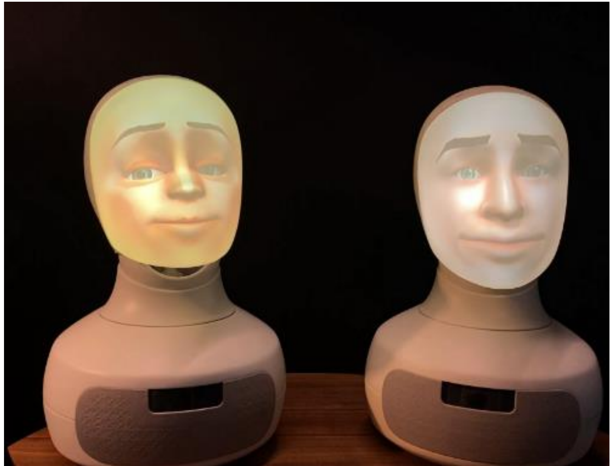
Bildkälla: Furhat Robotics. Använd med tillstånd.