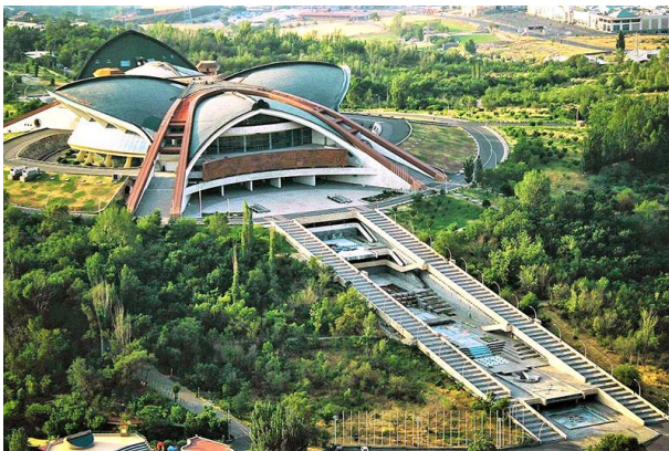
Рис. 7. Спортивно-концертный комплекс имени Карена Демирчяна