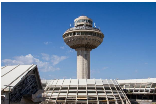
Рис. 9. Старое здание аэропорта Звартноц