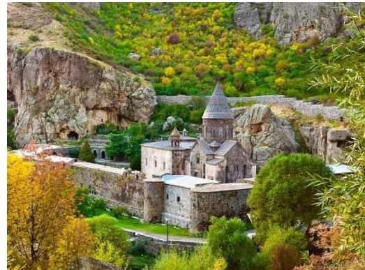
Рис. 3. Гегардаванк