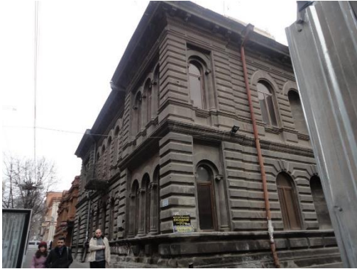
Рис. 32. Отреставрированное историческое здание в Ереване