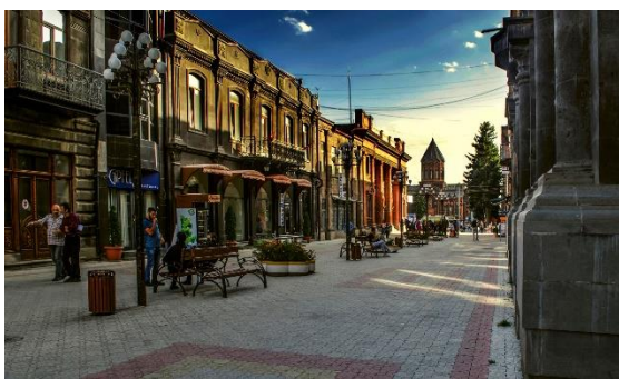
Рис. 30. Жилые и коммерческие здания в Гюмри