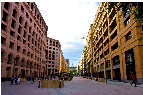
Рис. 14. Жилые и коммерческие здания на Северном проспекте (Ереван)