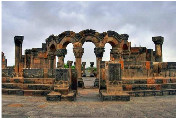
Рис.2. Собор Звартноц