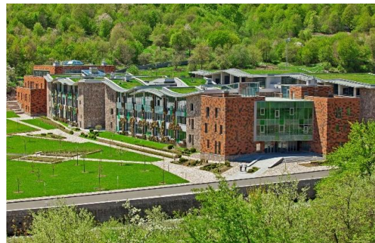
Рис. 23. Международный колледж в Дилижане