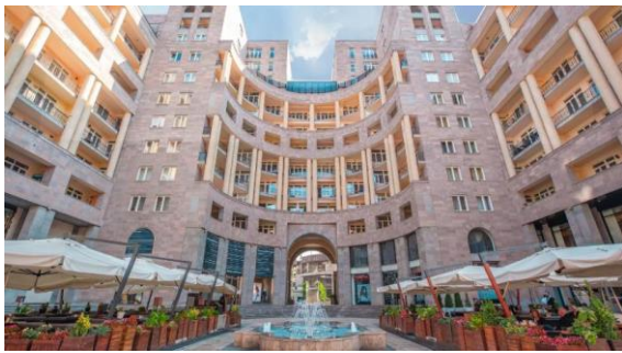
Рис. 12. Жилые и коммерческие здания на Северном проспекте (Ереван)