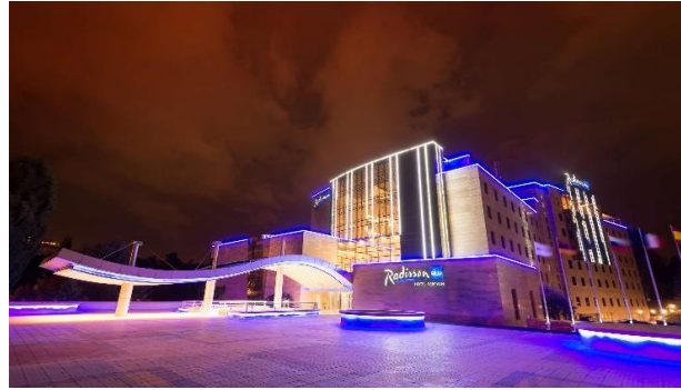
Рис. 25. Гостиница в Ереване