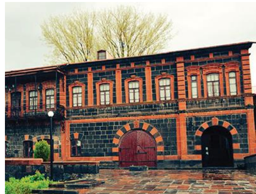
Рис. 29. Отреставрированное историческое здание в Гюмри