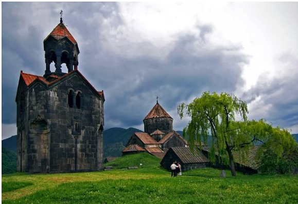
Рис. 4. Ахнат