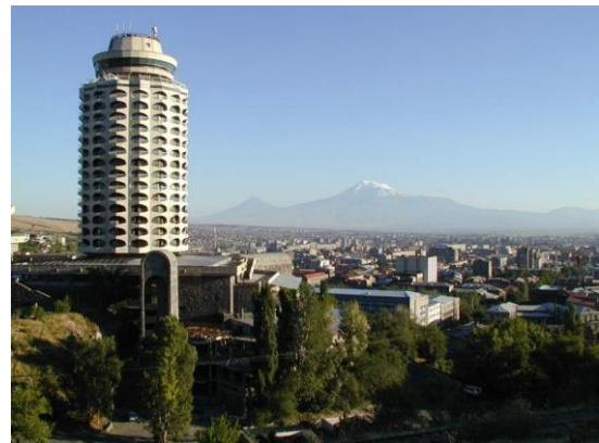
Рис. 8. Дворец молодежи