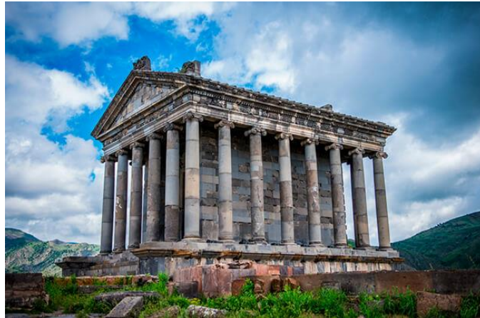
Рис.1. Греко-римский храм Гарни периптерного типа в Армении

чтобы координировать, противодействовать и решить данные проблемы, которые непосредственно представляют угрозу сохранению армянской архитектуры.