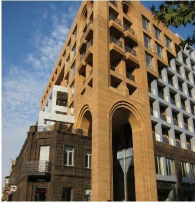
Рис. 16. Жилые и коммерческие здания на Северном проспекте (Ереван)