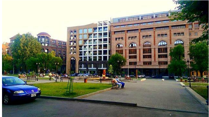
Рис. 17. Бизнес-центр в Ереване