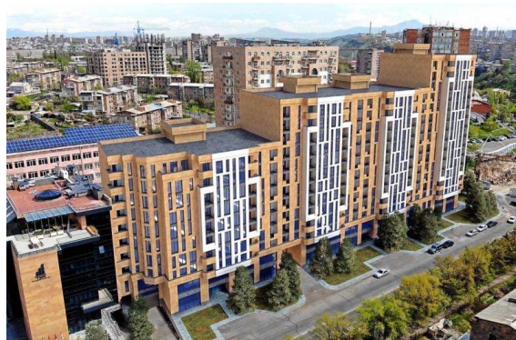
Рис. 21. Жилой дом в Ереване