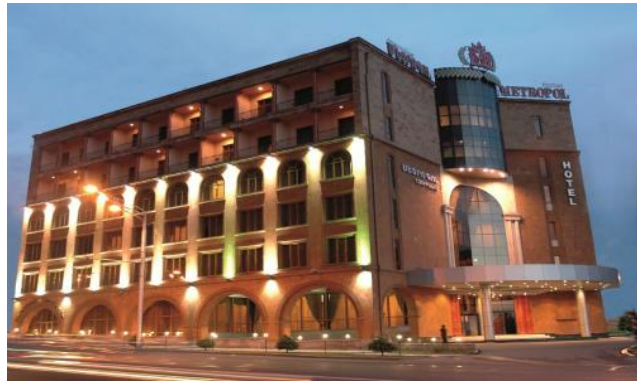
Рис. 27. Гостиница в Ереване