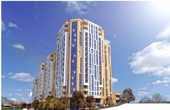
Рис. 20. Жилой дом в Ереване