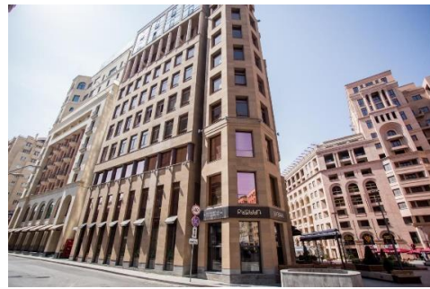
Рис. 13. Жилые и коммерческие здания на Северном проспекте (Ереван)