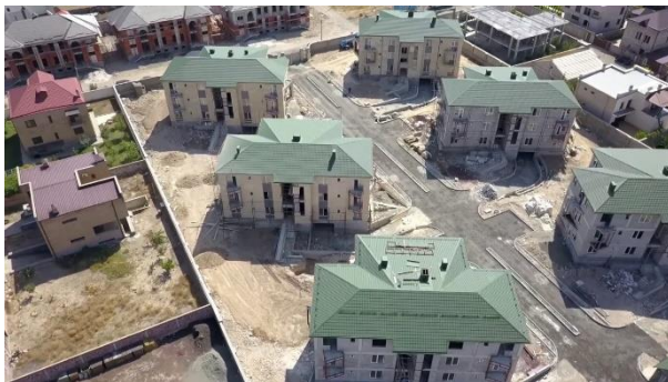
Рис. 22. Жилой квартал в Ереване