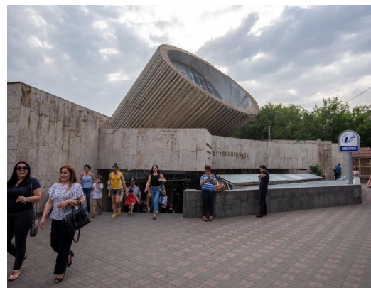
Рис. 10. Станция метро «Еритасардакан»