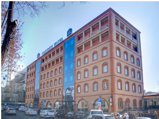
Рис. 28. Гостиница в Ереване