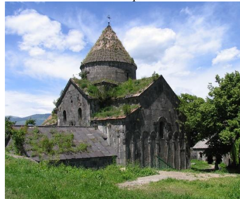
Рис. 5. Санаин