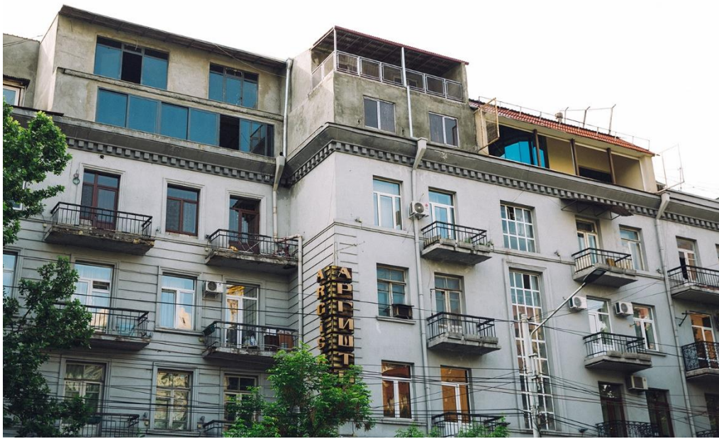
Рис. 11. Жилой дом в Ереване