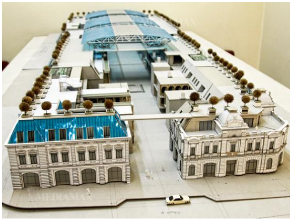
Рис. 34. Проект «Старый Ереван»