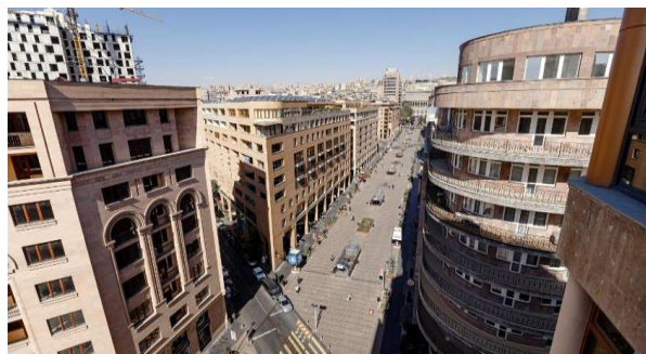
Рис. 15. Жилые и коммерческие здания на Северном проспекте (Ереван)