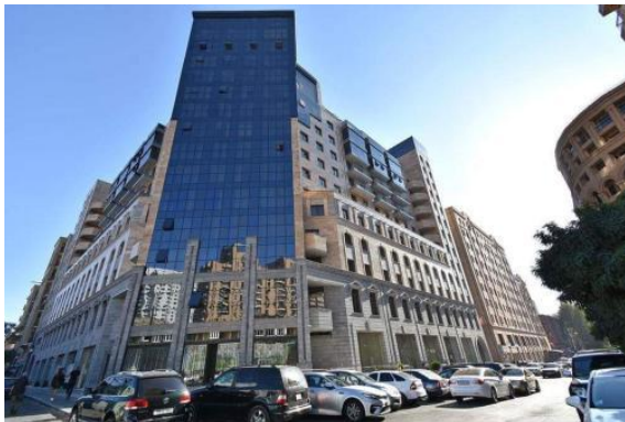
Рис. 18. Жилой дом и бизнес-центр в Ереване