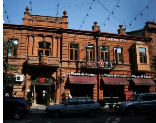
Рис. 33. Отреставрированное историческое здание в Ереване