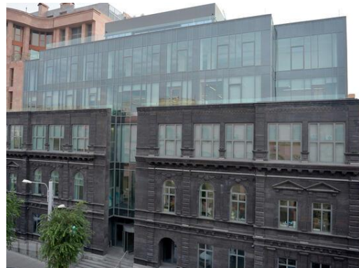
Рис. 19. Бизнес-центр в Ереване