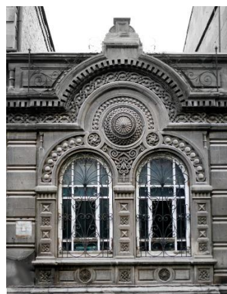
Рис. 31. Отреставрированное историческое здание в Ереване