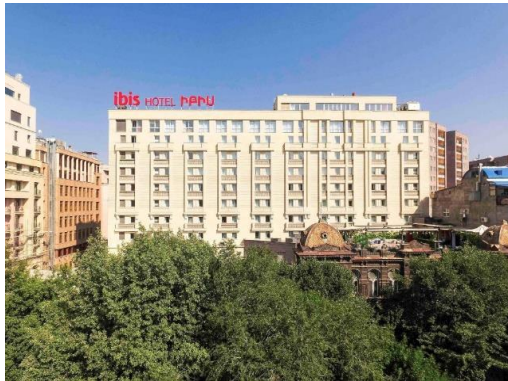
Рис. 26. Гостиница в Ереване