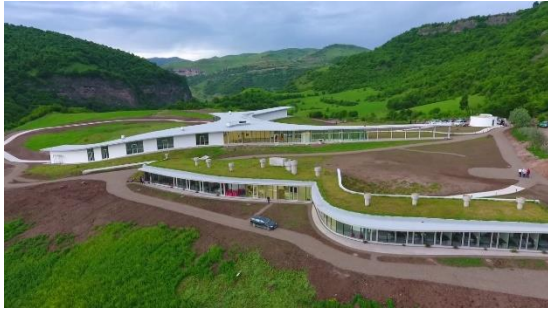
Рис. 24. Smart Center и гостиница в Степанаване