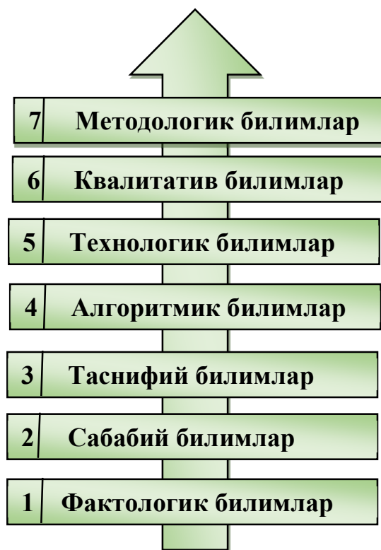
2-расм. Таълим квалитаксонларининг иерархик тузилмаси.

Ушбу тадқиқотда таълим квалитаксони, деганда маълум бир таксономик таълим модели доирасида ўрганилган фан модули ҳамда билим ва қобилият классификатори тушунилади. Таълим квалитаксонларини лойиҳалаш методологияси гуруҳий эксперт баҳолаш усулидан фойдаланган ҳолда тезаурус ва квалитетрик ёндашувларга асосланган. Университетнинг ўқув йўналишлари бўйича салмоқлилик коэффицентлари белгиланди: гуманитар ва ижтимоий-иқтисодий (ГИИ), математик ва табиий фанлар (МТ), умумий касбий (УК), махсус фанлар (МФ).