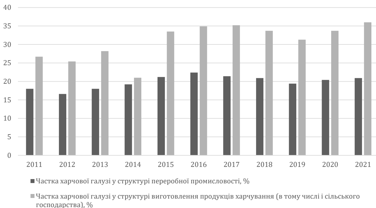
Рис. 2. Частка обсягів реалізації галузі виробництва харчової галузі у 2011-2021 рр.

на 4 682,4 млн дол., що у відносному значенні становить 1,7 %. При цьому харчова промисловість разом із продукцією агропромислового комплексу у 2021 році збільшила темпи експорту продукції на 0,2 % (загальна сума експорту у 2021 році становила 22 179,4 млн дол.), а в абсолютному значенні приріст становив 35,2 млн дол. [3].