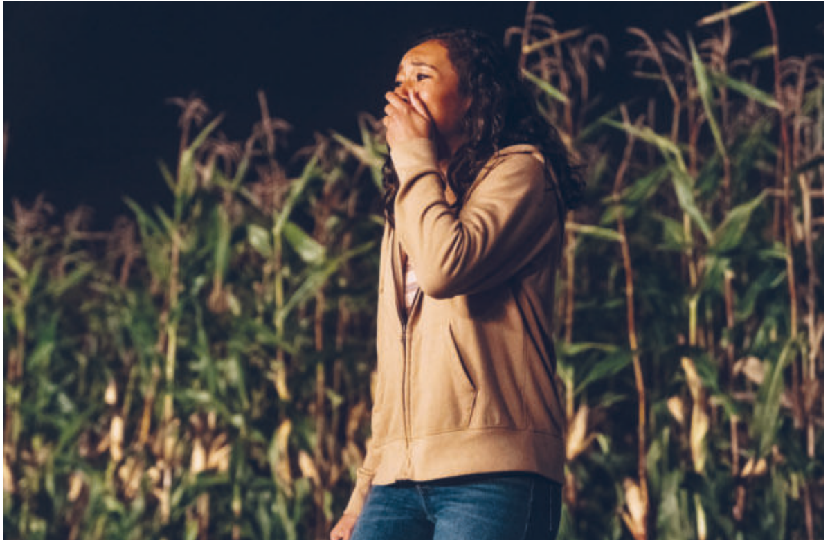
Im «reaction shot» ist der Schrecken nur auf dem Gesicht der Opfer ablesbar: ein Kunstgriff, der auch auf die Literatur übertragen wird. Jemand ist in deinem Haus. USA 2021.