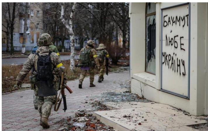
3-rasm. Ukraina Maxsus operatsiyalar kuchlari Baxmut yaqinida jangovar harakatlari

Donbassdagi 8 yillik urush davomida va keng ko‘lamli bosqin boshlanganidan beri MOK harbiy xizmatchilari ko‘plab harbiy operatsiyalarda ajralib turishdi, xususan, dushman bilan ochiq to‘qnashuvda va dushman ortida ham.