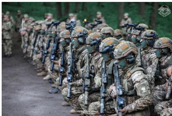
2-rasm. Ukraina MOK qo’mondonlik-shtab mashqlari.

Ukraina Qurolli Kuchlari MOK quruqlik-taktik guruhi– “Olovli qilich-2019” taktik mashqlarida (Litva, 2019 yil 12 – 28 iyun) qatnashdi (2-rasm). Uni amalga oshirish jarayonida Ukraina Qurolli Kuchlari MOKning 140 ta maxsus bo’linmalari guruhi NATOning tezkor javob berish kuchlari tarkibida sertifikatlanib va 2020 yildan boshlab Ukraina MOK bo’linmalari mavjud bo’lishi ko’zda tutilgan.