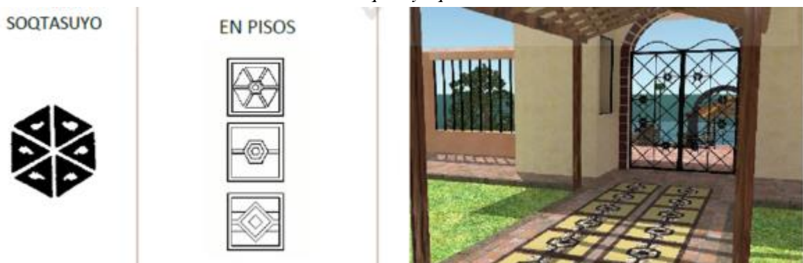
Figura 4. Símbolos textiles del soqtasuyo presente en acabados.

La funcionalidad arquitectónica del museo se desarrolló considerando los elementos culturales y tradicionales de la comunidad de Taquile. Se buscó un equilibrio entre la preservación de la identidad sociocultural y la creación de un espacio adecuado para exhibir las obras de arte textil (Chen, 2014). La forma arquitectónica se desarrolló a partir de la tradición y los materiales