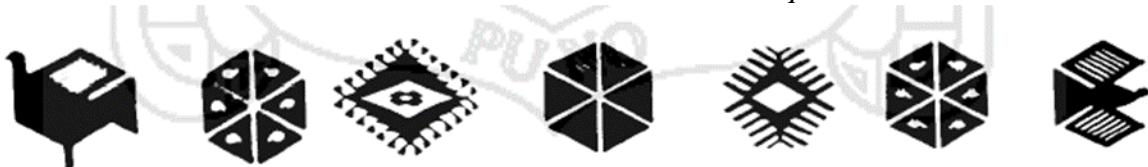
Figura 2. Símbolos textiles de la textilería de Taquile.

Además, la integración de teorías de la cultura, el turismo y la arquitectura permitió obtener una visión completa y detallada del proyecto, enfatizando la importancia de considerar los aspectos socioculturales y patrimoniales en la planificación y ejecución de proyectos turísticos y culturales. La integración de las teorías de la cultura, el turismo y la arquitectura en la metodología utilizada permitió obtener una comprensión completa y detallada del proyecto, lo que permitió la identificación de factores clave para garantizar el éxito y la aceptación del museo en la comunidad