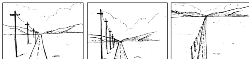
2 - rasm a,b,v.

Ufq chizig’i har doim ko’zimiz nuri balandligidan o’tadi. Agar biz yuqoriga chiqsak u biz bilan ko’tariladi, pastga tushsak ufq chizig’i ham pastda kuzatiladi (3 - rasm a, b, v).