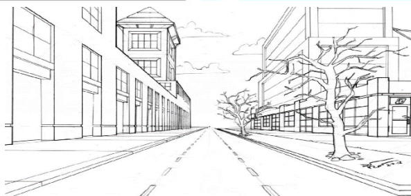
3 – rasm a.b.

Yorug'lik deb- predmet yuzasiga tik tushuvchi quyosh yoki sun'iy yoritgichlarning buyum yuzasida tashkil etgan nurga aytiladi.