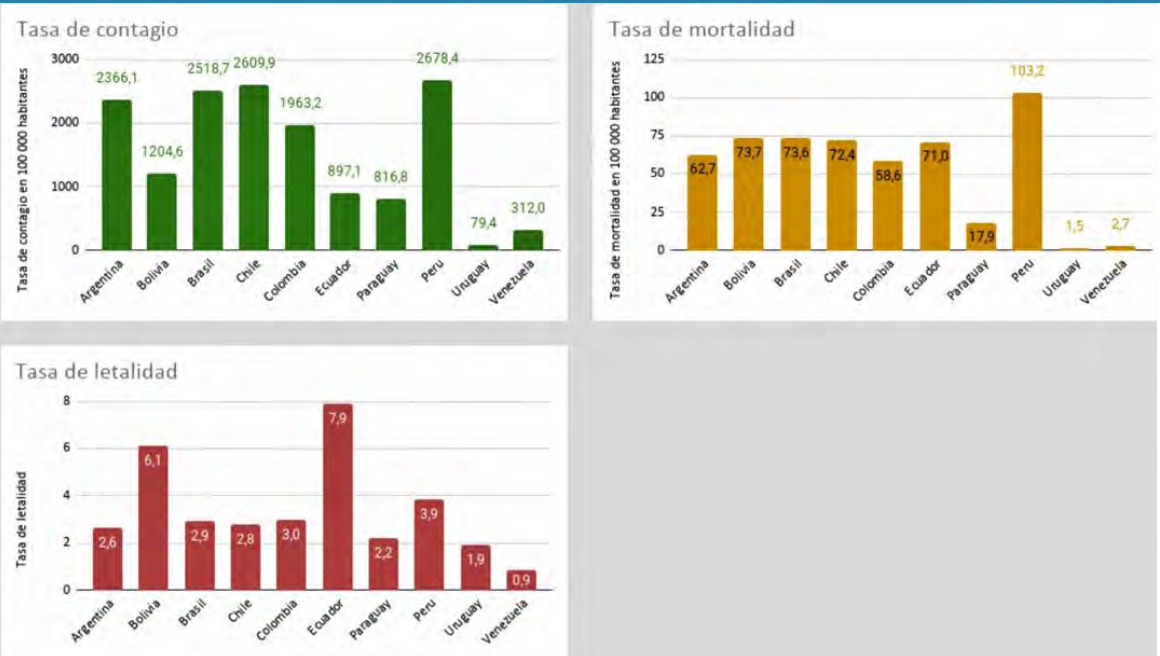
Figura 2. Tas de contagio, mortalidad y letalidad de COVID-19 diarios por cada 100 000 habitantes en Sudamérica.