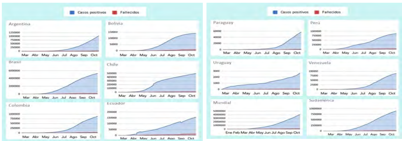
Figura 4. Curvas epidemiológicas de casos positivos y fallecidos en Sudamérica

Fuente de información: Proyección de las UN para la población en el 2020. Our World in data. https://ourworldindata.org/coronavirus-data