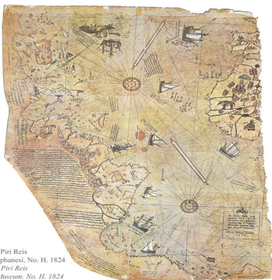
Dünya Haritasi, Piri Reis Топкапи Сарayı Müzesi Kütüphanesi. No. H. 1824 The World Map, Piri Reis Library of Topkapı Palace Museum. No. H. 1824