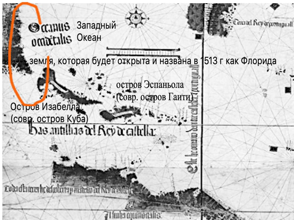
Рис. 1 / Fig. 1. Часть копии планисферы А. Кантино, 1502 г. / Part of A. Cantino's copy of the planisphere, 1502

Исследование земель вокруг обживаемого испанскими поселенцами о. Эспаньола продолжалось в первую очередь из-за необходимости испанцев в рабочей силе, в силу введённой энкомьенды [1; 2].