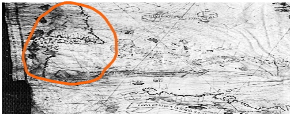
Рис. 2 / Fig. 2. Часть карты Николо Кавери, касающаяся Северной Америки / Part of the Caverio map concerning North America