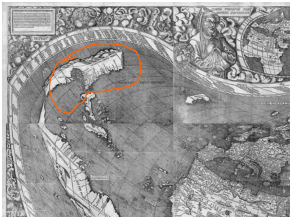
Рис. 3 / Fig. 3. Часть карты мира Мартина Вальдзимюллера, 1507 г. / Part of the World Map of Martin Waldsimüller, 1507