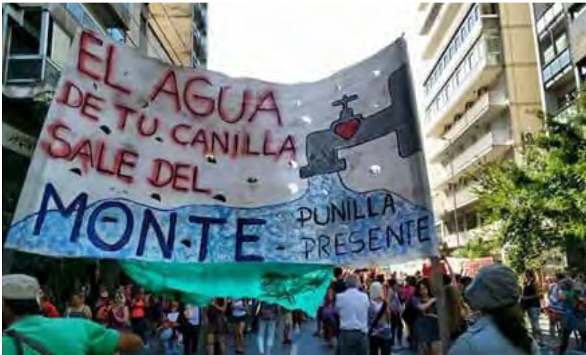
Fotografía N°1. Marchas en defensa del monte nativo y del agua, Córdoba, 2017.

Este tema ha tenido fuerte repercusión en la población, que viene realizando diversas actividades para demandar acciones contra el avance de los procesos que generan los desastres que afectan a las fuentes de agua y a los servicios públicos. Las Fotografías N°1, 2 y 3 presentan algunas de las marchas realizadas por la población en defensa del monte nativo y del agua en la Región Metropolitana de Córdoba.