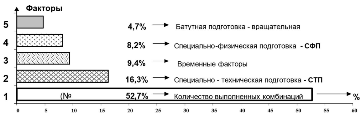
Рисунок. Факторная градация по значимости показателей тренировочной нагрузки (в %) на соревновательном этапе подготовки гимнастов.

На рисунке представлены пять факторов с различным процентным вкладом каждого из них в суммарную дисперсию: факторы количества выполненных комбинаций (вклад – 52,7%), количества выполненных элементов и опорных прыжков, как фактор специально-технической подготовленности - СТП (16,3%), временных показателей (9,4%), СФП (9,2%), батутной подготовки (4,1%).