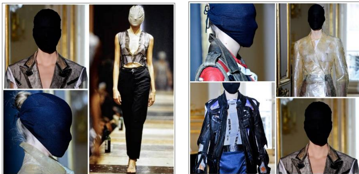
1-расм. М.Маржъела либос тўпламлари

Табиийки, мазкур жихат М.Маржъеланинг дизайнерлик фаолиятида ноодатий, авангард услубига хос бўлган костюм коллечияларини яратишига ҳамда мода оламида унинг “дизайнер-экспериментатор” номи билан аталишида катта аҳамият касб этган (1-расм).