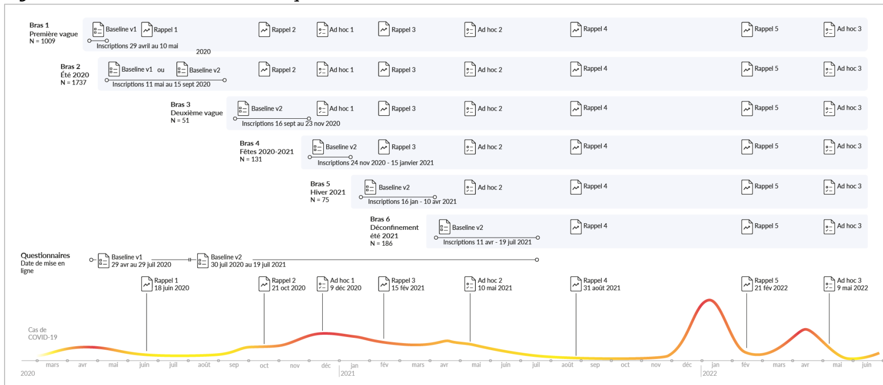
Figure 1 : Illustration de l’envoi des questionnaires aux différents « bras ». 1 2

*Les inscriptions ont été arrêtées le 19 juillet 2021. Le Bras 6 est le dernier Bras du projet. À partir de ce moment, tous les participants sont invités à répondre aux questionnaires de suivi.