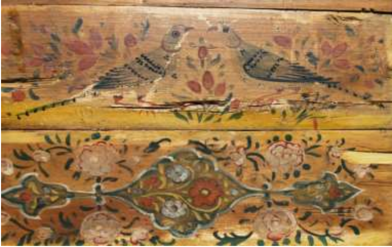
نمونه‌ای تازه‌یافت از گل‌ومرغ‌های ارسی