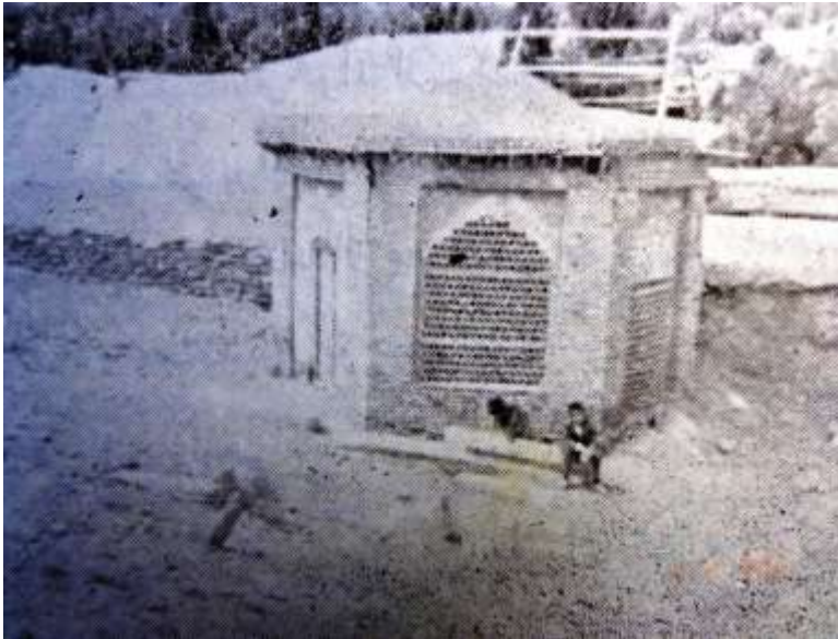
مقبره سید حسین در پشت بازار بالا (سال های سی شمسی) Shrine of Sayyid Ḥusayn b. Abū'l-Qāsim Ġa'far (died 1190 AH)

سید حسین، که در خوانسار به دنیا آمده، نوآموزی را با پدرش سید ابوالقاسم جعفر و شیخ محمدصادق عبدالفتاح تنکابنی آغاز می کند و سال ها بعد به صوابدید همان دو به عتبات می رود و به تحصیل ادامه می دهد. آوازه نبوغ و فصاحت و حسن خط او به همگان می رسد، تا جایی که او دیگر در طراز اکابر علمای زمان خود به حساب می آید. با آقاباقر بهبهانی (۱۱۱۷-۱۲۰۵ ه.ق) مراد دارد و میرزای قمی ۱۰ و سید مهدی بحر العلوم (۱۱۵۵ - ۱۲۱۲) هم از شاگردانش به شمار می آیند. سرانجام به زادگاهش بازمی گردد، اما این بار از زندگی گسترده دوری می کند و به امامت جمعه در مسجد چهارراه ۱۱ بسنده می کند و نوشتن را پیشه خود. او زاهدی متعبد است و به ترک خوانسار رغبتی ندارد، و همین امر سبب می شود تا شهرتی در دیگر بلاد نیابد، اما از آقاباقر بهبهانی نقل