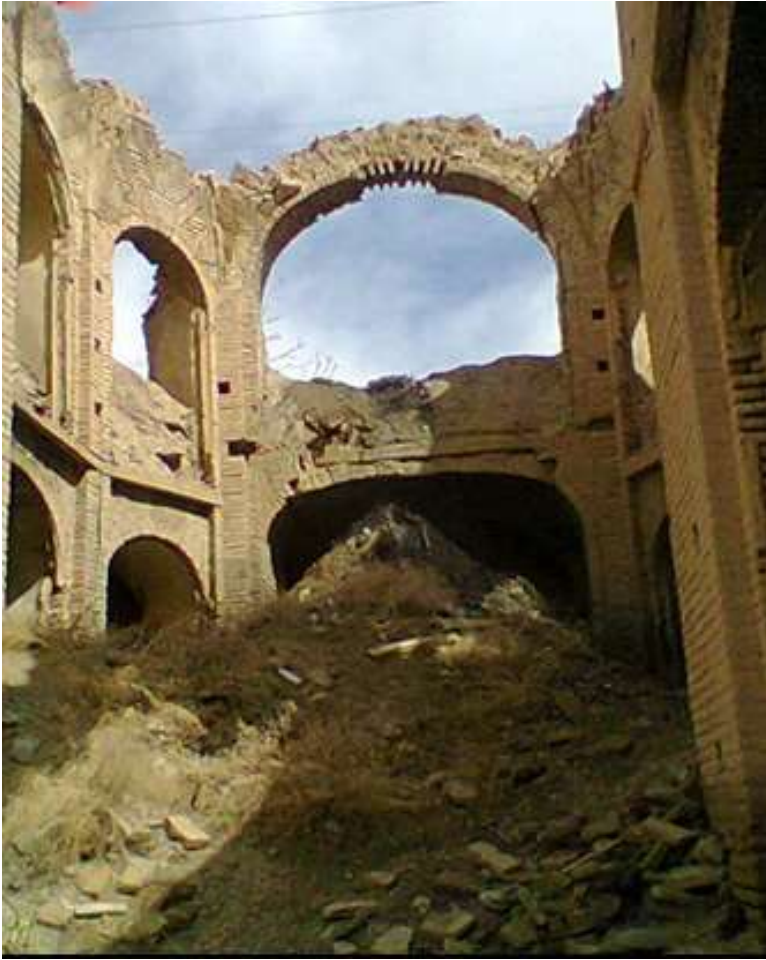
کاروان‌سرای عمارت میرمحمدصادق در سال‌های ۱۳۹۰ شمسی Caravanserai of “Imārat-i Mīr Muḥammad Šādiq”