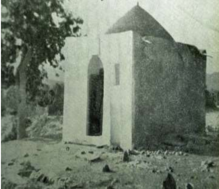
مقبره ابوالقاسم بن الحسین الحسینی الموسوی (سال‌های چهل شمسی، قودجان، حومه خوانسار) Shrine of Abū'l-Qāsim b. Ḥusayn al-Ḥusaynī al-Mūsawī (died 1157 AH = 1744 AD) Photo Courtesy of Najafzadeh.org (Copyright holder: Sayyid Ahmad Rouzati), circa 1960 AD)

ابوالقاسم ابن الحسین الحسینی الموسوی، یا سید ابوالقاسم جعفر حسینی موسوی، یا ابوالقاسم جعفر موسوی خوانساری، معروف به میر کبیر (۱۰۹۰ - ۱۱۵۷ قمری) ۱۷ وی که در سال ۱۰۹۰ قمری ۱۸ به دنیا آمده، خود را از شاگردان علمای مجلسی می‌داند و دیگران او را از اکابر علمای قرن دوازدهم می‌شمارند. هم پدرش از علماست و هم خود در عتبات به همراه سیدصدرالدین قمی به تدریس اشتغال دارد. سید ابوالقاسم جعفر که فتنه سال‌های ۱۱۳۳ قمری در اصفهان را آزموده است و از آن‌ها به ترداد هموم و غموم که در این آیام نهایت شیوع و عموم دارد یاد می‌کند، در سال‌های ۱۱۴۳ در خوانسار و در