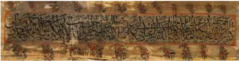
نمونه‌ای تازه‌یافت از گل‌ومرغ‌های ارسی