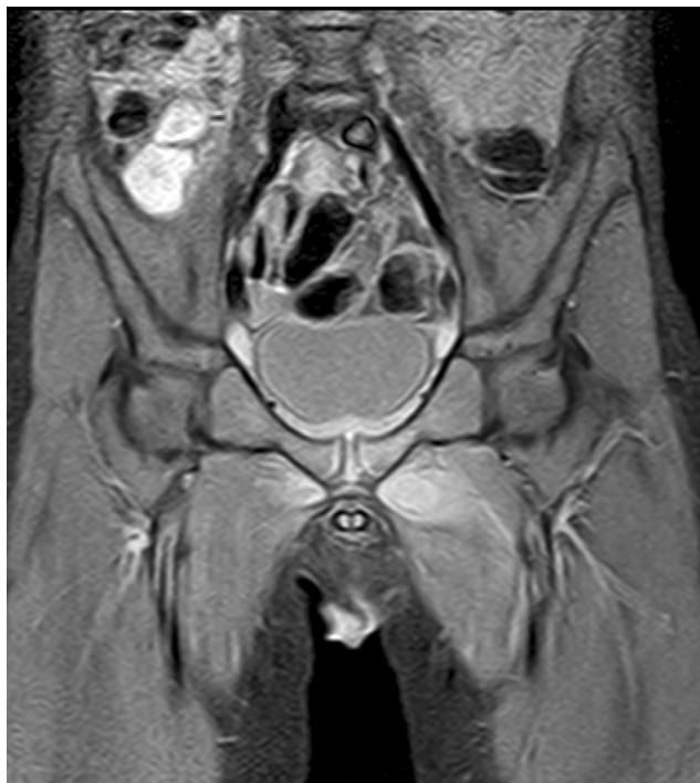
Figura 2 Resonancia magnética (corte coronal) ponderada en T2 con técnica de supresión grasa. Cambios de señal en el músculo aductor mayor izquierdo que alcanzan la sínfisis del pubis y se extienden discretamente al lado contralateral.