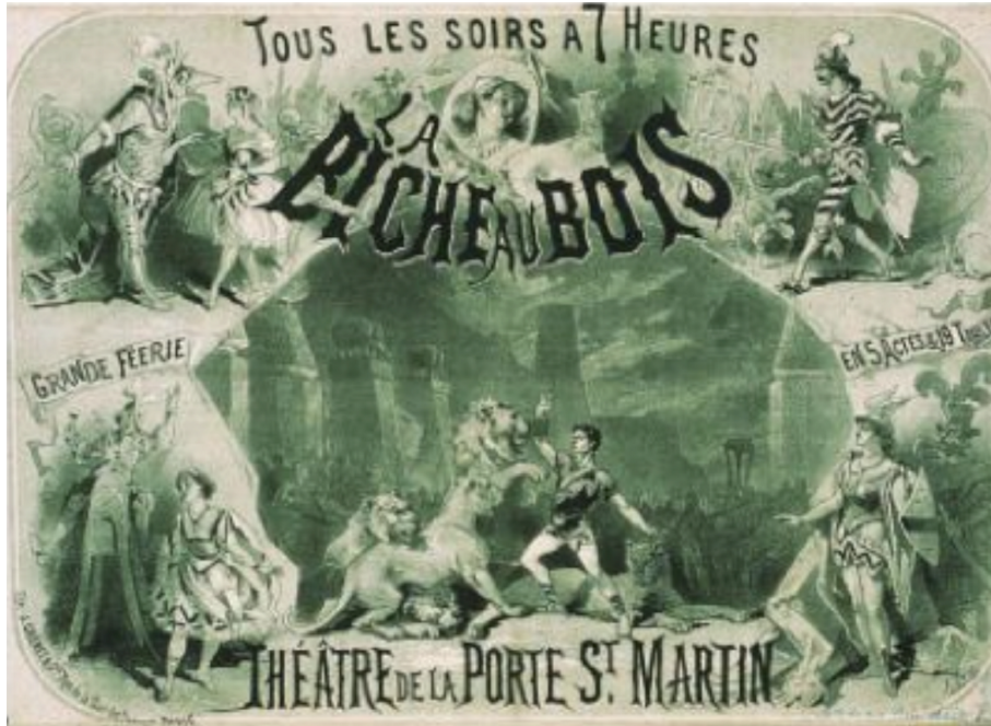
Resim 1. La Biche au Bois (Ormandaki Dişi Geyik). Joul Chéret'in 1886 da yaptığı ilk litografik afiş.

Resimli afişlerin gelişmesinde litografi baskısının bulunışundan 85 yıl kadar sonra önemli başka bir olay ise 1881 yılında Fransa'da çıkan basın özgürlüğüdür. Bu özgürlük önce Chéret, sonrasında Grasset ve Lautrec gibi daha birçok sanatçının afişe yönelmesini sağlamıştır. Özgürlük yasası, Fransız yasasının birçok sansür hükümlerini kaldırarak, afişlerin resmi ilanlar için ayrılan alanlar ve kiliseler dışında her yere asılabileceğine izin vermesi, afiş endüstrisinde büyük bir gelişmeye yol açmıştır. Sokaklar, toplumun her kesiminden insanların izleyebildiği bir sanat galerisi haline dönüşmüş, saygın ressamlar artık reklam afişi tasarlamayı küçültücü bir davranış olarak görmekten vaz geçmişlerdir (Bektaş,1992:18). Diğer taraftan 1870 Fransa-Prusya Savaşı'nın ardından, üçüncü Fransa Cumhuriyeti döneminde ortaya çıkan Belle Époque (Güzel Devir) güzel sanatların, edebiyatın, şampanyanın, müziğin ve eğlencenin yaygınlaşmasından, eğitimin, ekonominin, bilim ve teknolojinin iyileşmesinden adını