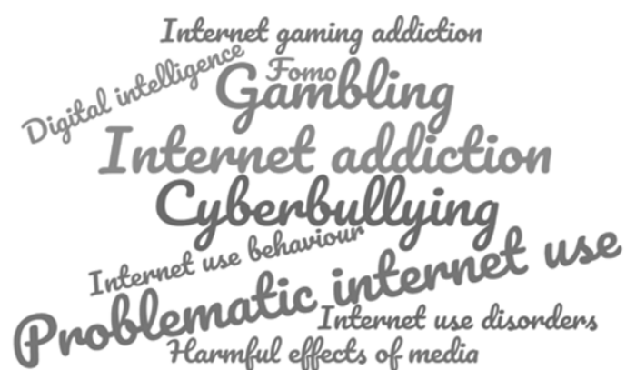
Figura 2. . Nube de Palabras Clave

El resto de las palabras clave utilizadas una única vez, se corresponden con aspectos muy concretos dentro de la adicción a internet: FOMO - fear of missing out - (Citko y Owsieniuk, 2020), digital intelligence quotient (Singh Chawla, 2018), excessive use of online-enabled devices (King et al., 2018), Internet use disorders (Nakayama et al., 2017) y Harmful effects of media (Strasburger & Council on Communications and Media American Academy of Pediatrics, 2010).