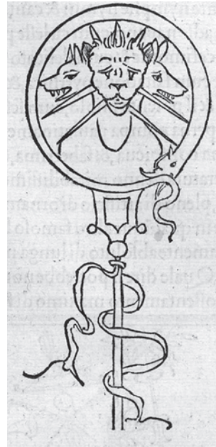
Abb. 12.4: Standarte mit Ou- roboros und Signum Triceps, in: Francesco Colonna: HYP- NEROTOMACHIA POLIPHIL- LI , Venedig 1499, Tafel 144.

Aus den nur latenten Vorstellungen, die im Datenmodell der TEI-XML-Daten ein Schema von erforderlichen und erlaubten Elementen und Strukturen zum Mi- nisterratsprotokoll machen, erstellt die eXist-db-basierte Webapplikation konkre- te Darstellungen. Die Listenansichten der Webapplikation (Abb. 12.5) ziehen aus