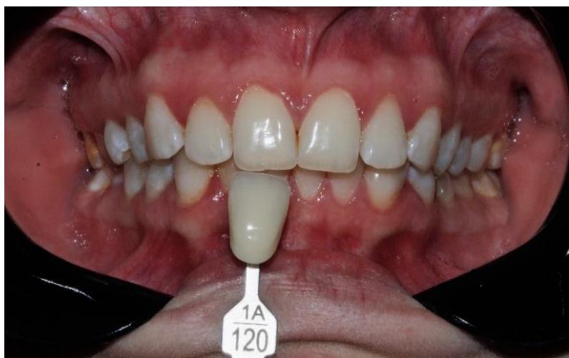
Figura 3: Toma de color inicial (1A-120).