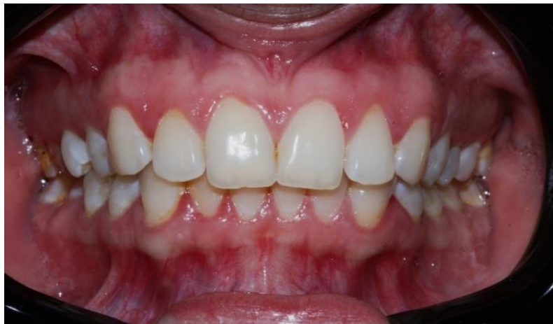
Figura 1: Aspecto inicial del paciente.

Representación del caso de análisis 1 es mostrado en la figura 1