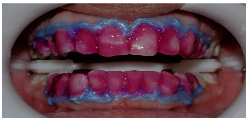
Figura 5: Aplicación de gel aclarador, peróxido de hidrógeno al 35%