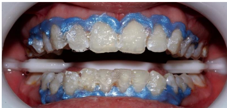
Figura 4: Aplicación del gel desensibilizante caras vestibulares.