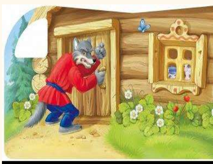
“Qizil shapkacha” ertagi