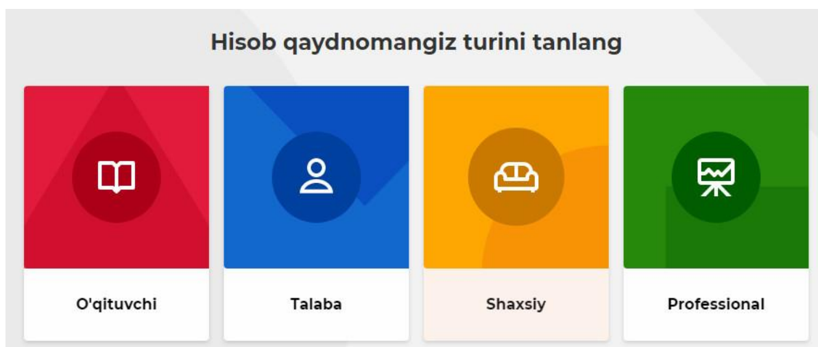
3-rasm. Tizimda "O'qituvchi" rolini tanlaymiz.

Kahoot veb sayti ishlash uchun, avvalo agar siz o'qituvchi bo'lsangiz, tizimda "O'qituvchi" maqomini bajaruvchiga tegishli ma'lumotlarni quyidagi maydonlarga ketma-ket kiritamiz. O'qituvchiga tegishli ma'lumotlar mos holda tegishli maydonlarga kiritilgach o'qituvchiga mo'ljallangan "Ish joyini tavsiflash" interfeys ochiladi.