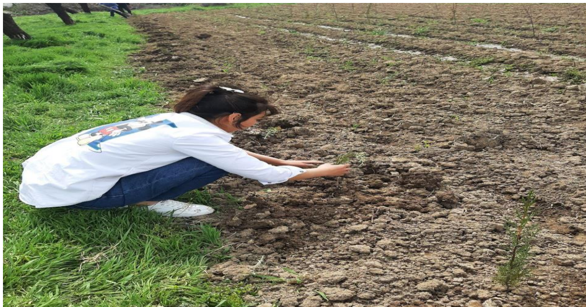
4-Rasm. C.ARIZONICA tajriba dalasidaqalamchasidan ekish jarayoni.