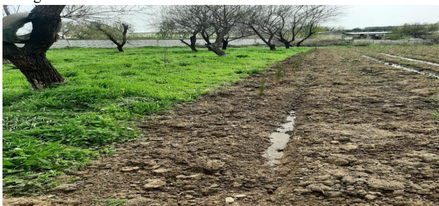
1-Rasm. C.ARIZONICAni vegetativ ko'paytirish.

Cupressus Arizona quruq muhitga moslashgan doim yashil ignabargli daraxt bo'lib, urug' bilan ko'payadi. Balandligi 21 metrgacha bo'lgan oddiy daraxt -20 . -25 ° S gacha bo'lgan sovuqqa bardosh qiladi. Sarvning boshqa turlariga nisbatan og'irroq va bardoshli yog'ochga ega. Qalamchasidan va urug'idan ham vegetativ tarzda ko'paytiriladi. Doim yashil daraxt hisoblanadi. 2022-yil o'tkazilgan tajribalarimizda: urug'idan, qalamchasidan ko'paytirish texnologiyasini ilmiy asoslash uchun o'rgandik.