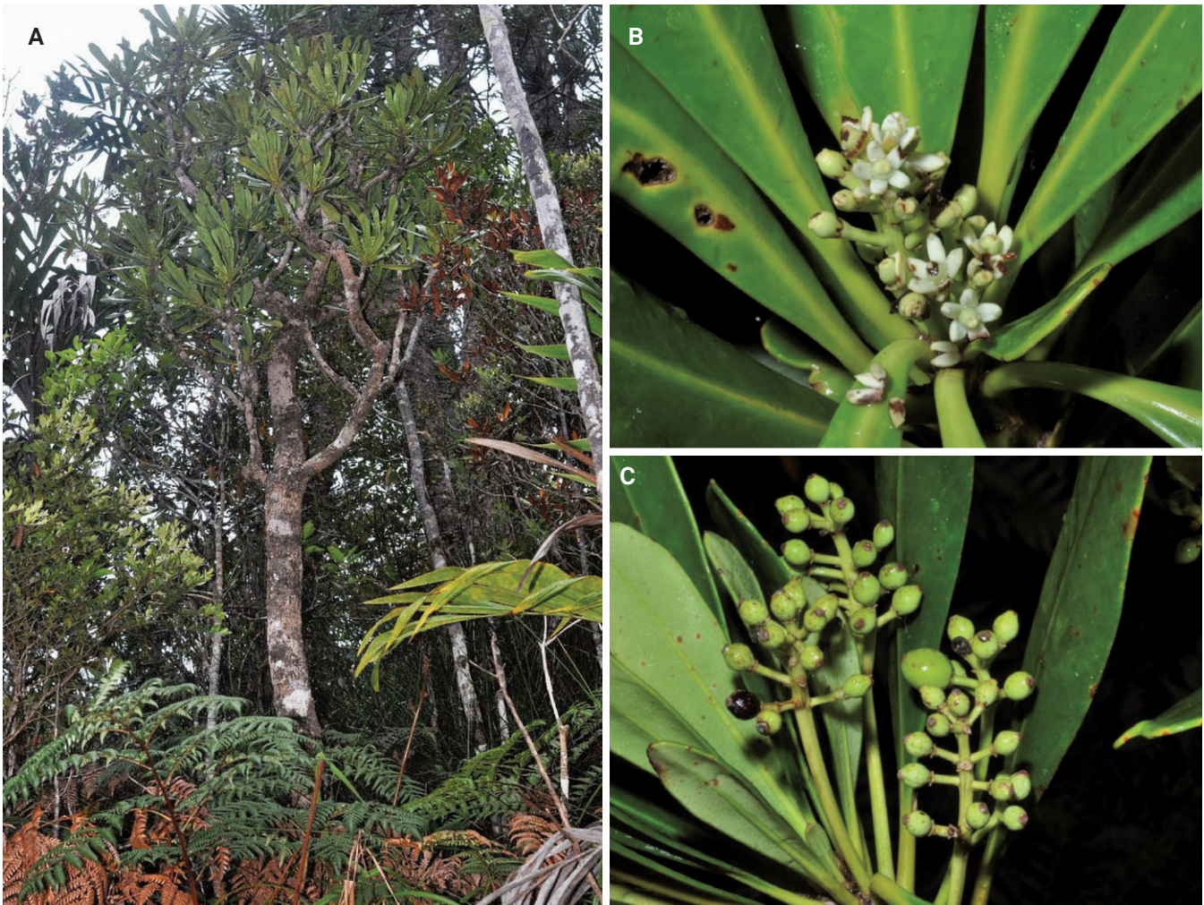
Fig. 2. – Phelline barrieri Barrera & Schlüssel. A. Habitus; B. Inflorescence femelle; C. Jeune infrutescence. [A, C: Callmander et al. 1260; B: Callmander et al. 1262]

Phénologie. – Les fleurs mâles au stade boutons uniquement ont été récoltées en avril, juillet et octobre. Les fleurs femelles ont été récoltées au stade boutons en août et octobre et à maturité en juillet et novembre. Une seule collection récoltée en juillet contient des fruits immatures et mûrs (Schmid 5310), tous les autres spécimens n'ont que des ovaires fécondés ou des fruits immatures et ont été récoltés en janvier, juillet, août, novembre et décembre.