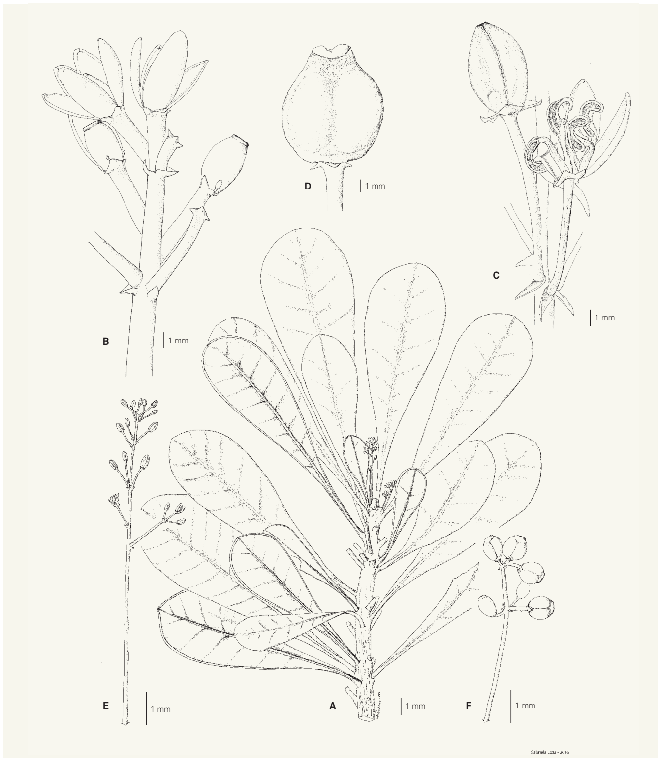
Fig. 1 – Phelline barrieriei Barrieria & Schlüssel. A. Rameau femelle; B. Fleurs femelles; C. Fleurs mâles; D. Fruit immature; E. Inflorescence mâle; F. Jeune infrutescence. [A-B: Callmander et al. 1262, G; C, E: Morat 5043, P; D, F: MacKee 27072, P] [Illustration: Gabriela Loza]