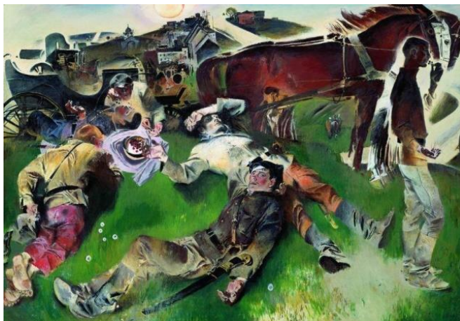
Рисунок 2. Моисеенко Е.Е. «Черешня»