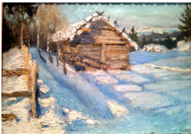
Рисунок 3. Грабарь И.Э. «Зимний вечер»