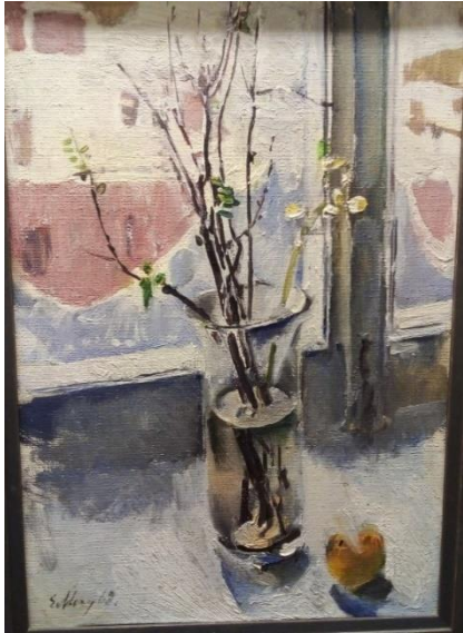
Рисунок 5. Моисеенко Е.Е. «Натюрморт с вербой»