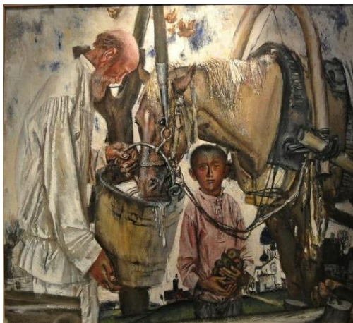
Рисунок 1. Моисеенко Е.Е. «У колодца»