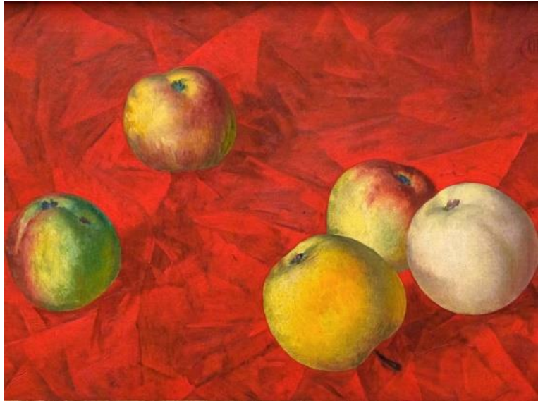
Рисунок 6. Петров-Водкин К.С. «Яблоки»