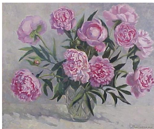
Рисунок 4. Васильева Е.И. «Пионы в вазе»