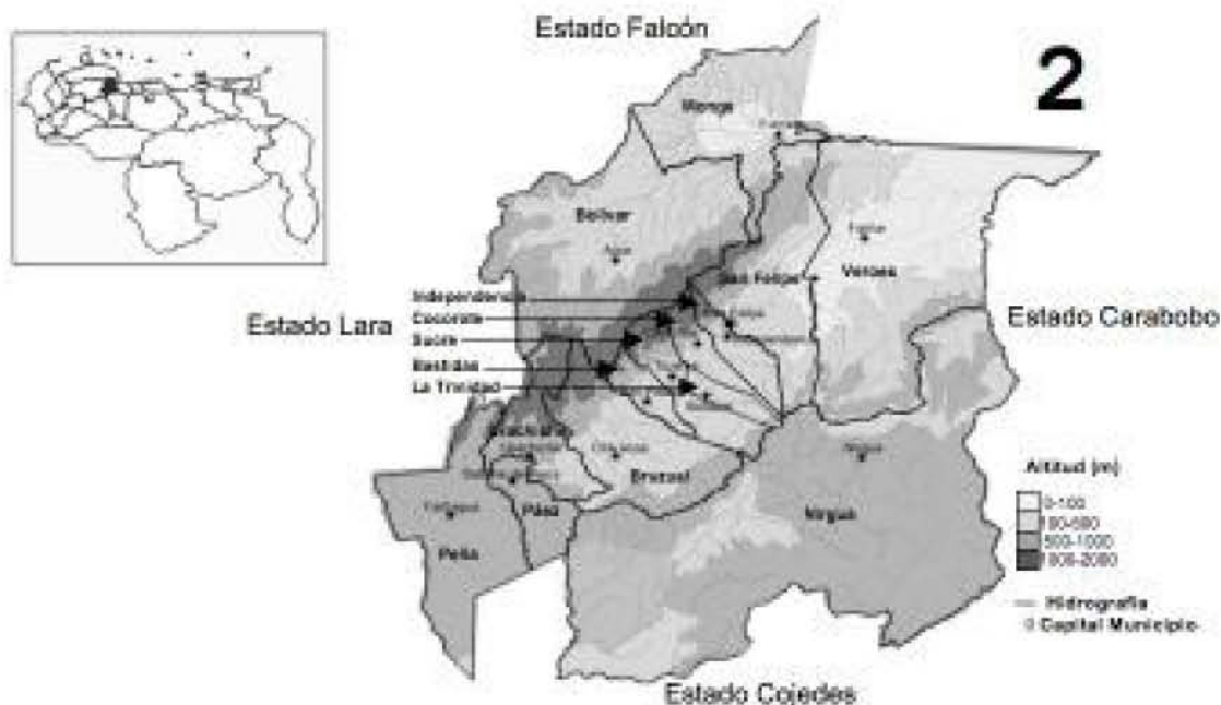
Figura 1. Ubicación geográfica, relieve e hidrografía del estado Yaracuy y sus municipios

superficie de 0,28 millones de hectáreas agrícolas y dividido políticamente en 14 municipios (Figura 1). Predominan las unidades de paisaje montañoso, que junto con el piedemonte de colinas, representan el 65% de su territorio. El clima de la entidad, de acuerdo a la Clasificación Climática de Kóeppen es de sabana (Aw) y de estepa (Bs) con una temperatura media anual entre 20° y 26° C y precipitación media de 1.900 mm anuales. La actividad económica predominante es la agricultura. Destacan rubros como el maíz, el cambur, la caraota, la caña de azúcar, el café, el sorgo, el plátano, el aguacate, la naranja y otras frutas. En el sector pecuario sobresalen la ganadería de bovinos, porcinos y aves. La entidad, en términos económicos, produce bienes y servicios con mayor intensidad para los estados vecinos que para su circulación interna (Ferrer y De Paz, 1985).