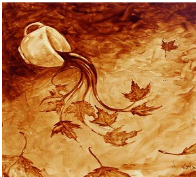
Рис. 3 – Картина «Coffee in the Fall», художник Энджел Саркела-Соур 5

менее известны, но достаточно перспективны, в том числе в рамках событийного туризма. Также в последнее время появляется много украшений и элементов интерьера, сделанных с применением кофейных зерен или в соответствии с кофейной тематикой.