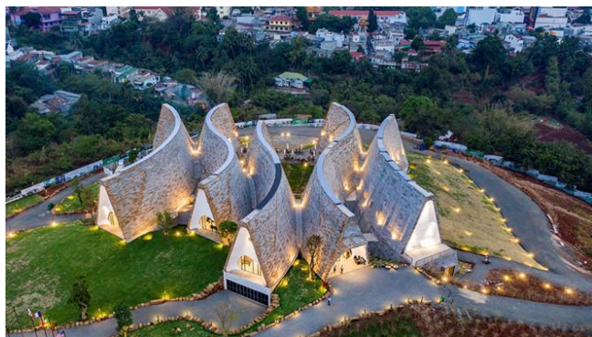
Рис. 4 – Всемирный музей кофе, Вьетнам 7

Одним из молодых музеев является «Всемирный музей кофе» во Вьетнаме, открытый для посетителей 23 ноября 2018 г. (рис. 4). Он привлекает посетителей редкой архитектурой. Это длинный дом в виде полиморфных и гибких кривых, пересекающихся друг с другом. Музей хранит более 10 тысяч экспонатов, связанных с тремя типичными кофейными цивилизациями мира, уходящего вглубь почти трех веков. В музее также имеются выставочные площади и смотровые площадки для кофе и библиотека.