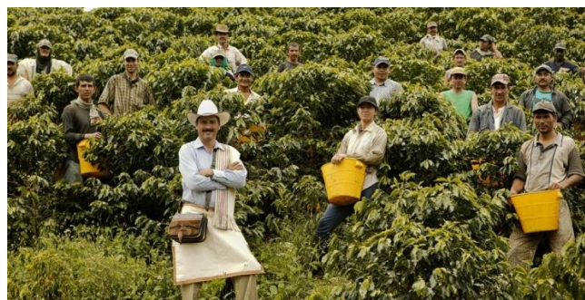
Рис. 2 – Посещение кофейных плантаций 3

Сельский туризм представлен, прежде всего, отдыхом в гостевых домах и фазендах в сельской местности, где распространены кофейные плантации. Во время посещения традиционных кофейных районов туристы участвуют в различных видах сельскохозяйственных работ, им предлагаются конные поездки, чтобы полюбоваться красивыми пейзажами. Остановиться можно прямо на одной из фазенд, так как многие фермеры активно принимают туристов (рис. 2).