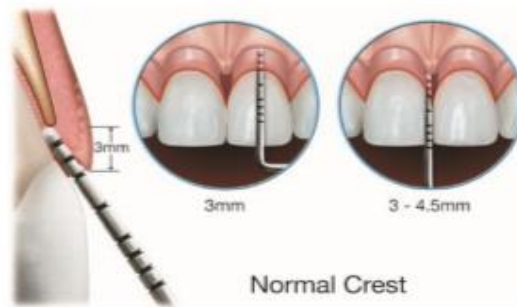
FIGURE 9 Illustration of the Normal Crest patient.