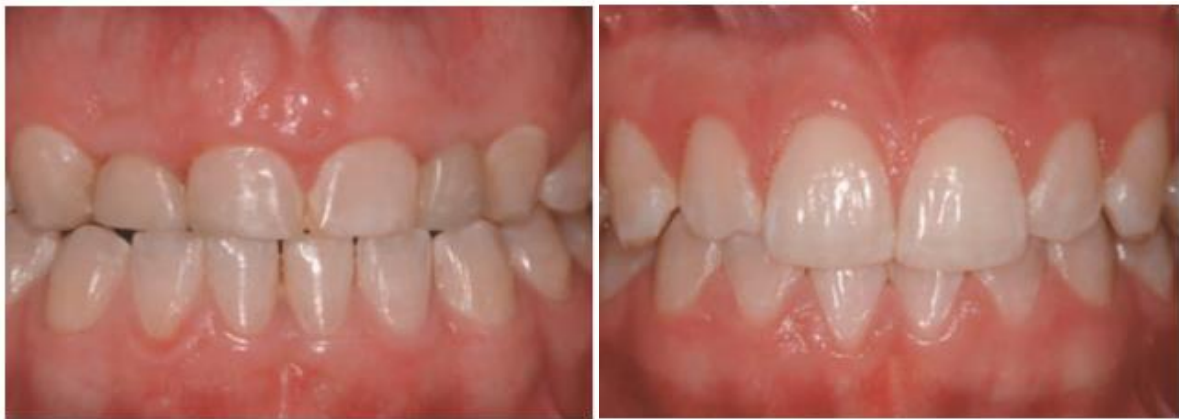
Figura 4. Vista seis semanas después del tratamiento de alargamiento de corona [19].

Existen dos biotipos distintos de periodonto, fino y grueso, al realizar una cirugía que modifique el grosor del periodonto incluye el colgajo y hueso alveolar (osteoplastia y osteotomía.) El cuidado de este tipo de cirugía debe ser minucioso pues puede inducir una recesión gingival o una reabsorción ósea postquirúrgica. Las razones para el tratamiento de las coronas clínicas cortas suelen ser restaurativas o prostodóncicas, aunque en ocasiones puedan ser puramente estéticas. Por otro lado, en las áreas interproximales posteriores, la caries a menudo se extiende en sentido apical exigiendo técnicas quirúrgicas que nos permitan acceder a sus márgenes más apicales para la consecución exitosa del tratamiento restaurador [1]