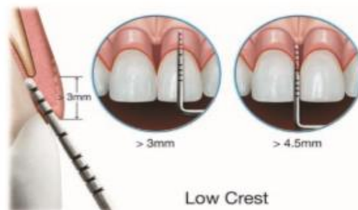
Figura 2. Tipo de cresta gingival [16].