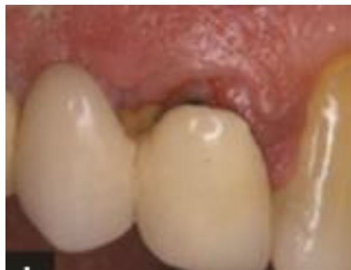
Figura 3. Deficiente ajuste marginal [17].

Cuando intentamos extendernos para lograr tener más corona clínica, es decir conseguir una línea de terminación protésica más apicalmente, podemos ocasionar invasión del espacio biológico, afectando directamente la anchura biológica con nuestro tallado, ocasionando una inflamación crónica del periodonto, pérdida de hueso alveolar, recesión gingival y formación de una bolsa periodontal [1].