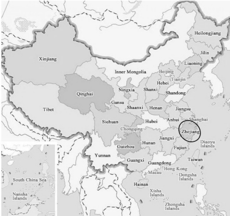
Fig. 1 – Localizzazione della Provincia dello Zhejiang.