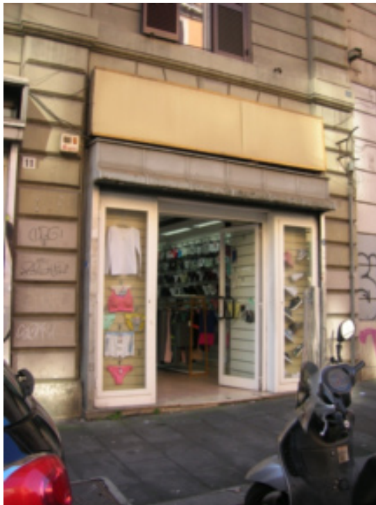
Fig. 3 – Negozio showroom cinese nel rione Esquilino.

In primo luogo, i testimoni cinesi prendono le distanze da fantasiose ipotesi di illegalità e delinquenza, “mafia cinese” e riciclaggio: accuse che procurano loro particolare sofferenza. I negozi cinesi di abbigliamento o scarpe che sono tacciati di avere scarsa clientela e poca merce esposta, come gli stessi gestori confermano, sono showroom e lavoravano all'ingrosso. Le pareti e le vetrine presentano campionari di prodotti che vengono ordinati sempre più spesso “da remoto” (fig. 3).