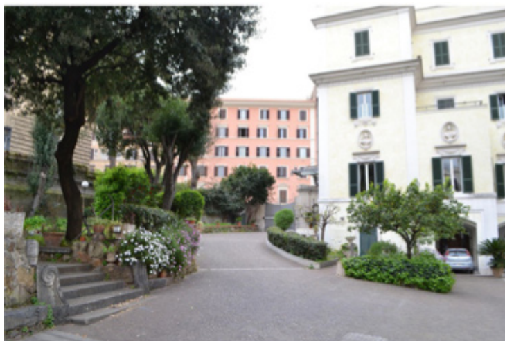
Fig. 4 – Il cortile interno dell'Istituto Scolastico Paritario “Figlie di Nostra Signora al Monte Calvario” (2016).

Nella scuola secondaria di I grado paritaria “Figlie di Nostra Signora al Monte Calvario” (fig. 4) dal 2005 è cominciata una politica di inclusione sociale