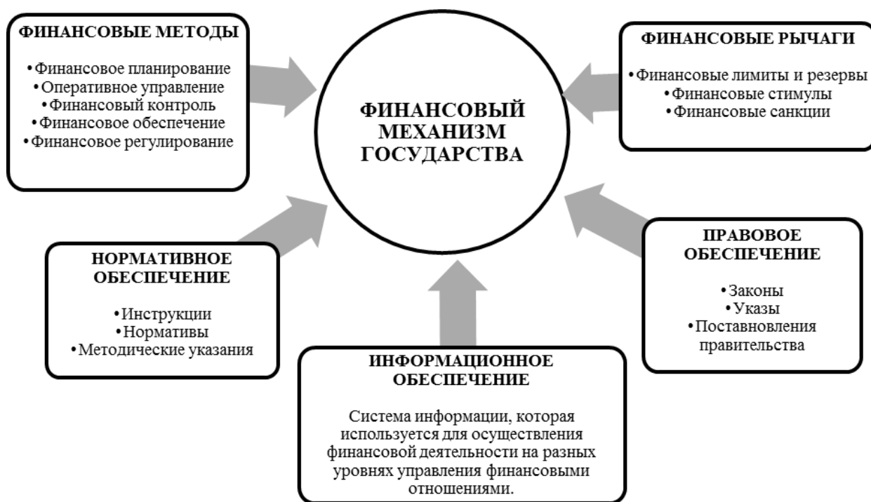
Рис. 5. Составляющие финансового механизма

Изложив теоретические основы формирования финансовой политики государства, перейдем к рассмотрению практических аспектов ее реализации на примере федерального бюджета Российской Федерации (РФ).