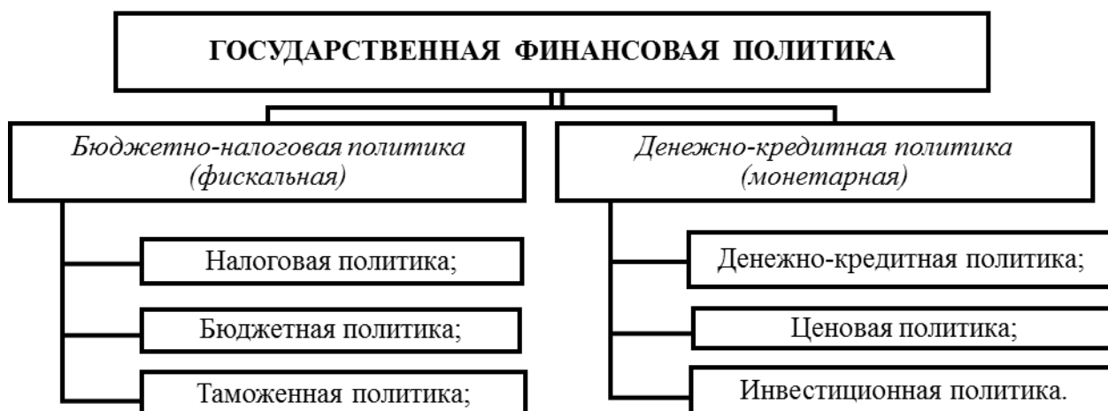
Рис. 4. Составляющие элементы государственной финансовой политики

Согласно данной классификации финансовая политика государства включает следующие составные элементы (рис. 4).