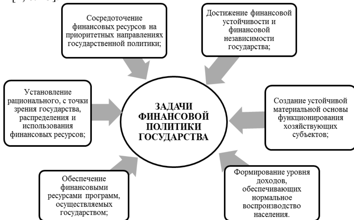
Рис. 1. Задачи финансовой политики государства

В соответствии с рассмотренными целями выделяют главные задачи финансовой политики государства, представленные на рис. 1 [1, с. 15].