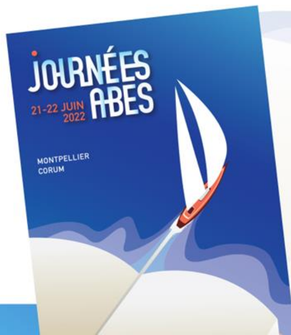
Table-ronde JABES 2022