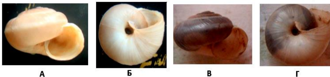
1-расм. L. schileykoi тури: А, Б-Бойсун тоғ тизмаси Мачайдара дарёси ҳавзасидан, В, Г-Ҳисор тоғ тизмаси Тўпаланг сув омбори атрофидан йиғилган материаллар.

L. schileykoi турининг географик ўзгарувчанлиги, Бойсун тоғ тизмаси, Мачайдара дарёси ҳавзаси ва Ҳисор тизмаси Тўпаланг сув омбори атрофида тарқалган моллюскаларда ўрганилганда, у қуйидагича: ҳар икки тоғ тизмасида тарқалган моллюскаларнинг чиғаноқ шакли, қалинлиги, скульптураси ва киндик тузилиши бири-бирига ўхшаш бўлиб, фақат чиғаноқ рангида ўзгарувчанлик аниқланиб, Бойсун тоғ тизмасида тарқалган моллюскалар чиғаноқ ранги оч-жигарранг бўлса (1-расм. А, Б), Ҳисор тизмасидаги моллюскаларда эса шохсимон бўлиб, эмбрионал қисми қўнғир тусга эга (1-расм. В, Г).