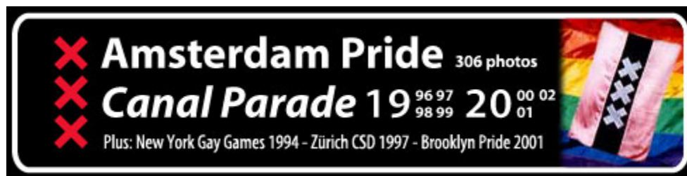
Banner op de homepage 113

Een cultuurhistorisch belangrijke lhbt+-homepage met historische informatie is een fraai ontworpen site van een graphic designer die waarschijnlijk rond 2002 op het web is verschenen. 111 Deze (helaas fragmentarisch bewaarde) XS4ALL-homepage heeft een deel met foto's van de Amsterdam Pride Canal pride uit de periode 1996-2002. 112