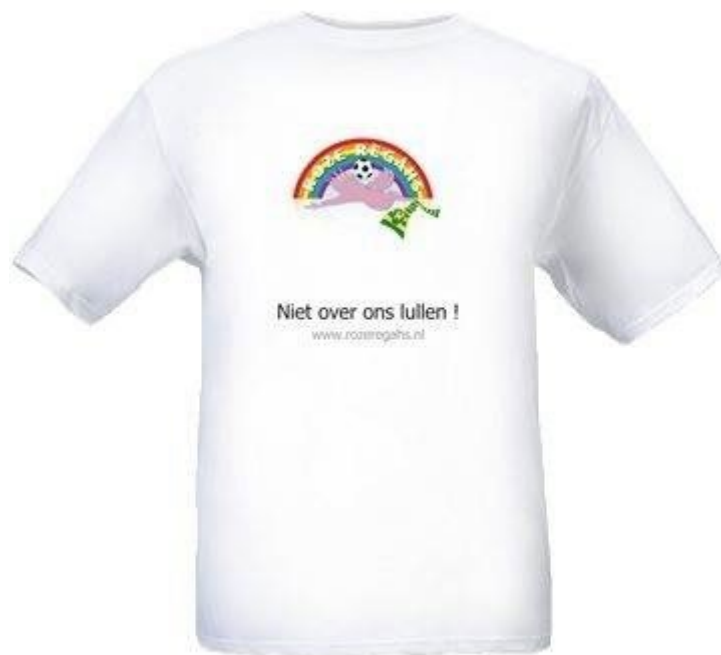
Shirt van Roze Règâhs met URL

ADO Den Haag in het bijzonder. De Stichting De Roze Règâhs heeft tot doel het bespreekbaar maken en accepteren van homoseksualiteit binnen de sport, het voetbal en ADO Den Haag in het bijzonder. De Stichting De Roze Règâhs biedt LHBT fans van ADO Den Haag een platform om over onze sport en club de discussiëren.