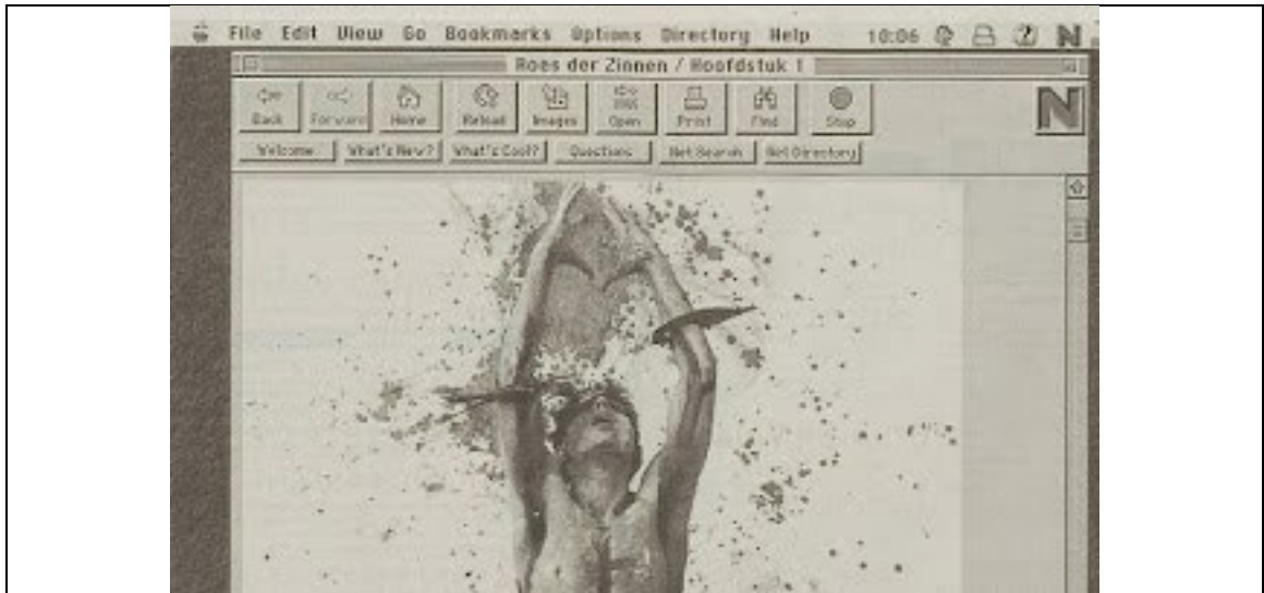
Een schermfoto uit de Provinciale Zeeuwse Courant (PZC), 11 maart 1996