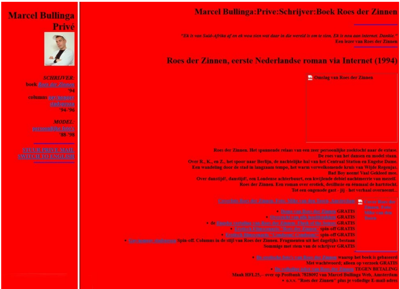
Homepage Roes der Zinnen, ca. 2000 (zonder omslag) 80