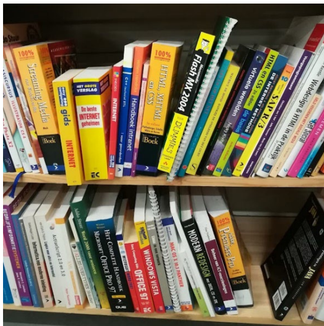
Opname van een boekenkast in een kringloopwinkel te Ypenburg Den Haag in 2019 met webgidsen, zoals 'de beste internetgeheimen'

Een andere historische bron van de geschiedenis van lhbt+-sites zijn webdirectories of linklijsten. In de begindagen van het web bestonden er nog geen zoekmachines en waren sites of homepages vrijwel uitsluitend te vinden door lijsten met websites door te ploegen. Dergelijke overzichten konden zowel op papier zijn afgedrukt als als website zijn vormgegeven. De eerste websites en homepages van de wereld bestonden zelfs vrijwel uitsluitend uit lijsten van met verwijzingen naar andere sites of emailadressen. 32 Heel veel digitale internetgeschiedenis is nog uitsluitend te reconstrueren door middel van gedrukte internetgidsjes, tijdschriften met websites, artikelen over het web in kranten en reclames voor websites in publicaties. Vaak is juist dergelijk drukwerk slecht bewaard of niet in de KB terechtgekomen. Daarom zijn de onderste planken van het boekengedeelte van kringloopwinkels vaak een rijke bron van onbekende of vergeten webgeschiedenis.