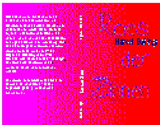
Omslag Roes der zinnen (1994) 79

De belangstellende lezer kon op een XS4ALL-homepage het eerste hoofdstuk lezen en vandaar ook printen. Mocht de inhoud bevallen, dan was het mogelijk om de andere 25 hoofdstukken bestellen die op floppy disk werden thuisgestuurd. De site bevatte ook 'hypermedia' foto's van 15 fotografen. Deze roman was één van de eerste pogingen om Nederlandse literatuur via het web te publiceren, te verspreiden en te verkopen. Wat betreft innovatie lijkt deze publicatie erg op het vroege literaire tijdschrift De Opkamer op het web, dat ook literatuur over lhbt+-thema's bevatte en een vroege webshop had.