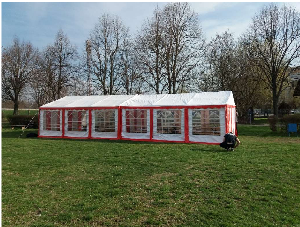
2. kép 2x30m 2 -es csapatsátor