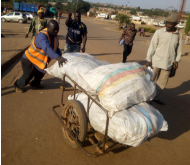
Photo 1. L'usage des pousse-pousse à Ngaoundéré (Maïpa, septembre 2018)