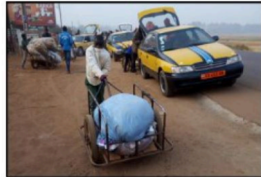
septembre 2018.