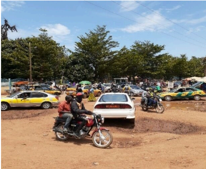
Photo 3. Circulation et stationnement anarchique au lieu-dit ÉNÉO (Sadio Fopa, mai 2021)

Le taxi de ville qui assure principalement les liaisons centre-périphérie est également un acteur du désordre urbain constaté dans la ville. Le fait que l'adhésion à un syndicat soit volontaire pousse les personnes non syndiquées à aller chercher les clients et les clientes dans des zones interdites par les pouvoirs publics. Ce qui occasionne des saturations sur la voie publique (photo 3).