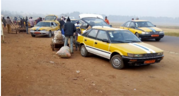
Photo 2. Stationnement des taxis collectifs à Dang un jour de marché (Maïpa, septembre 2018)