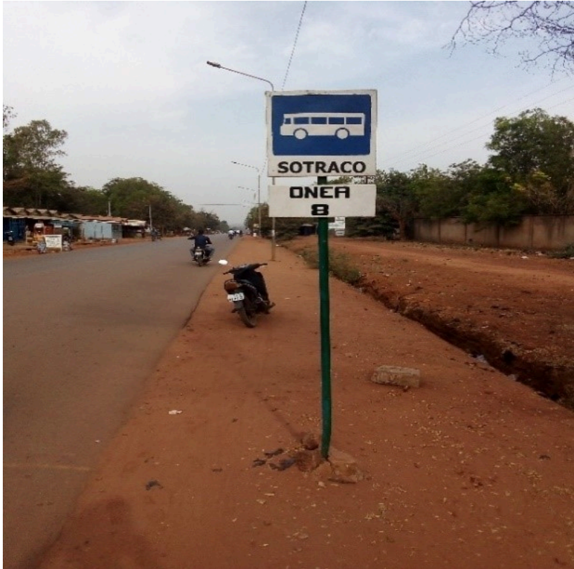
Photo 2. Une station (arrêt) de bus à Bobo-Dioulasso

Comme on peut le voir sur l'image, l'absence de hangar est un élément qui traduit l'inconfort lors de l'attente du bus. On remarque également qu'aucune indication n'est donnée sur les horaires d'arrivée et de départ des véhicules. Ce qui laisse les éventuels clients et éventuelles clientes sans repère. Des études réalisées sur le recours aux bus dans la capitale Ouagadougou ont également souligné les longues heures d'attente et l'inconfort comme handicaps à l'utilisation du bus (Essone, 2012; Kafando, 2006). Force est donc de constater que les leçons n'ont pas été tirées des faiblesses du système d'exploitation de la même compagnie dans la capitale. Pourtant, une étude de marché et des rencontres entre les