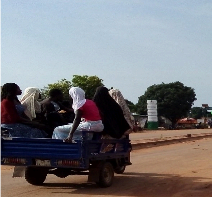
Photo 1. Tricycle au cœur de la circulation transportant des passagers (vue d'un tricycle avec ses passagers à bord en direction du centre-ville)