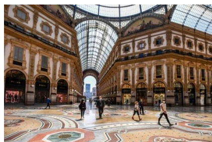
Миландаги Виктор Эмануел галереяси. 1867-й. (генплан , план , интерер).

Ҳозирги давр савдо майдонларининг бетартиб жойлашиши асосий муаммолардан бири ҳисобланади. Иқтисоднинг жадал ривожланиши шаҳар атроф муҳитини ва шаҳарсозлик кўринишига уни режалаштиришга салбий таъсир кўрсатмоқда чунки, савдо расталари ва майдонларда одамларнинг тартибсиз тўпланиши бунга сабаб бўлади. Ривожланган хорижий давлатларда деҳқон бозорлари сепермаркетлар ўрнини боса оладими? деган савол кўплаб тадбиркорлар, мулк эгаларини ўйлантириб келмоқда. Европа, АҚШ, Осиё давлатларида бозорларни йирик савдо комплекслари таркибида ташкил қилиш анъанаси мавжуд бўлиб, аҳоли кўп яшайдиган ҳудудларни қамраб олиши савдо ва бозор эгаларининг мақсадидир. Деҳқон бозорлари арзон нархлар ва маҳсулотларнинг ҳозиржавоблиги билан харидорларни ўзига жалб қилади. Бундай бозорлар асосан аҳоли зич яшайдиган ҳудудларда фаолият юритади.